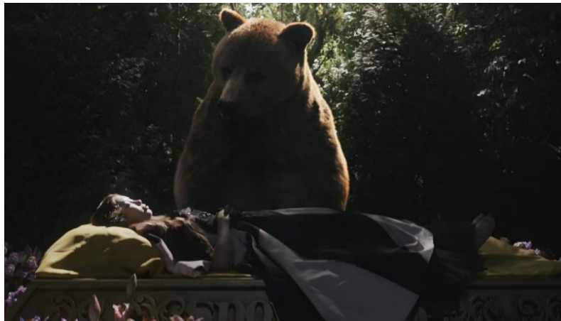
Gambar 9. Scene 9 shot 8 MV New Jeans "OMG"