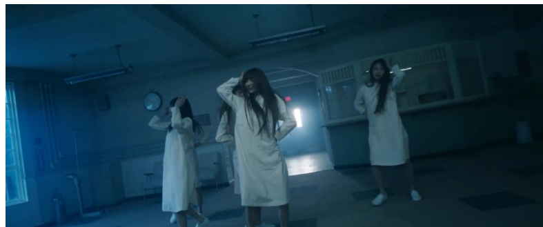
Gambar 5. Scene 1 shot 32 MV New Jeans "OMG"

Scene 1 Shot 4 (00:09-00:11), 6 (00:39-00:43), 12 (01:35-01:38), 32 (02:33-02:35)