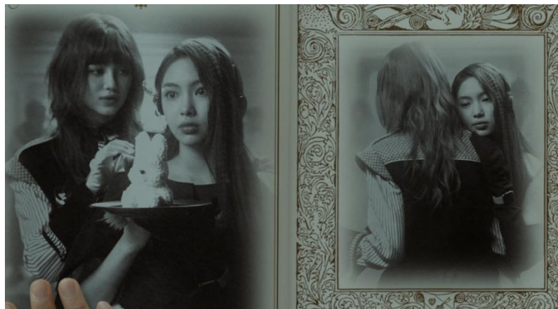
Gambar 8. Scene 9 shot 1 MV New Jeans "OMG"