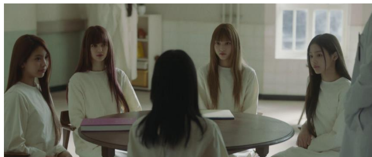
Gambar 2. Scene 1 Shot 1 MV New Jeans "OMG"