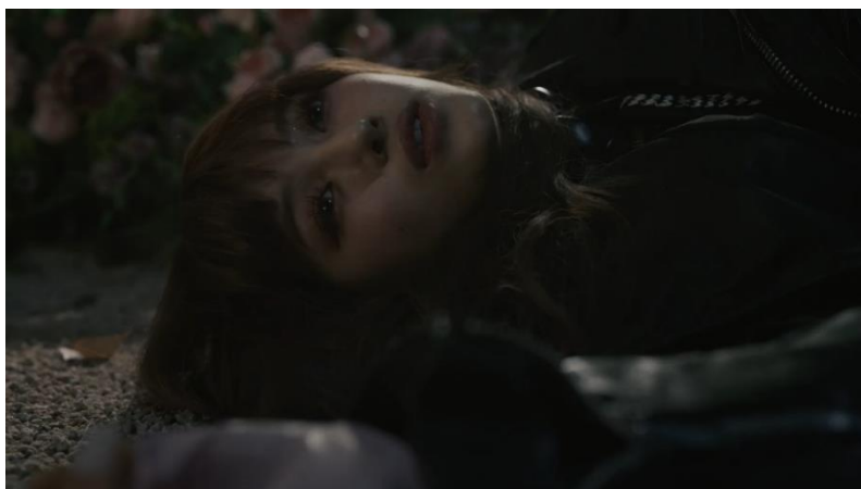
Gambar 10. Scene 9 shot 9 MV New Jeans "OMG"

Scene 9 shot 1 (02:37-02:42), 8 (03:15-03:16), 9 (03:19-03:23)