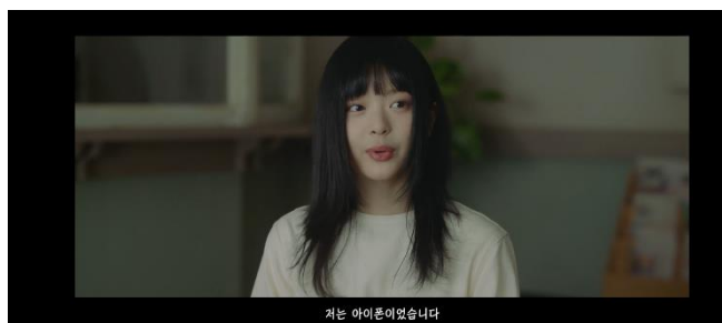
Gambar 6. Scene 2 shot 6 MV New Jeans "OMG"