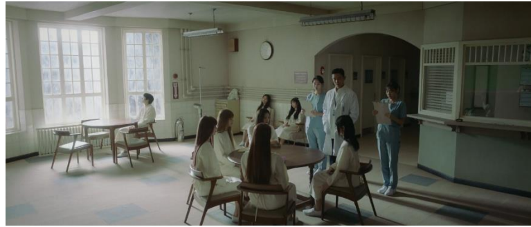
Gambar 4. Scene 1 shot 12 MV New Jeans "OMG"