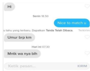
Gambar 4. Tingkat Episode

“pernah nyantol di tinder akhirnya chat asyik trus move lanjut ke whatsapp dan yaa lanjut aja chatting gitu trus pernah sih sampe telepon” (Sumber : Wawancara dengan Nadia, Seven Sidoarjo, 22 Januari 2023).