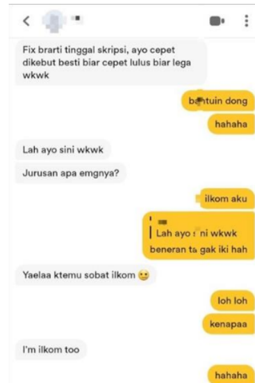
Gambar 5. Tingkat Naskah Kehidupan

“berbagi pengalaman tentang dating app sih biasanya aduh gimana ya jelasin susah hehe. Jadi misal kayak dia cerita banyak cowok yang ditemui begini begitu terus sebaliknya lah aku juga cerita. Dan yaa kencan online emang seru banget sih menurut aku pribadi” (Sumber : Wawancara dengan Anugrah, Kav. DPR Sidoarjo, 24 Januari 2023).