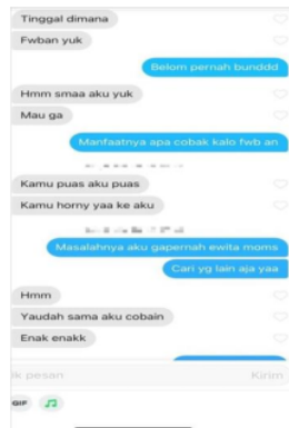
Gambar 6. Tingkat Episode

“hehe ini aku sih yang bodoh. Kalo inget juga ngerasa bodo banget aku. Waktu itu pernah ketipu sampai berjuta-juta dia pinjem namaku buat pinjol sampai alamat rumah juga kan dipakai terus dia kabur gak bertanggung jawab. Mau gak mau ya aku yang bayar utangnya”(Sumber : Wawancara dengan Tyas, Es the Sukodono, 16 Januari 2023).