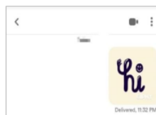
Gambar 3. Tingkat Tindak Tutur

“di bumble kan cewe dulu tuh yang harus chat jadi ya aku kirim gift gitu kadang kalau enggak ya cuman say hai, trus sih ya tanya-tanya tentang yang ada di bionya” (Sumber : Wawancara dengan Tyas, Es The Sukodono, 16 Januari 2023).