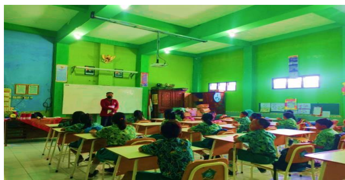
Gambar 2. Pembagian angket