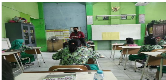
Gambar 3. Penerapan Metode Diskusi pada Siklus I

Pelaksanaan siklus I dilaksanakan pada Selasa, 2 Februari 2022 dengan alokasi waktu 3 x 35 menit di kelas IVB disalah satu sekolah dasar pada wilayah kecamatan Krian dengan jumlah 20 siswa yang terdiri dari 9 siswa laki-laki dan 11 siswa perempuan.