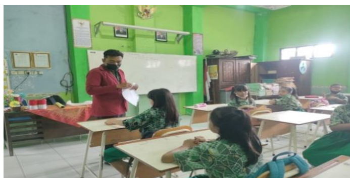
Gambar 4. Pembagian Angket pada Siklus II

Siklus II dilaksanakan satu kali pertemuan pada hari Rabu, tanggal 2 maert 2022 dengan alokasi waktu 3 x 35 menit di kelas IVB disalah satu sekolah dasar pada wilayah kecamatan Krian dengan jumlah 20 siswa yang terdiri dari 9 siswa laki-laki dan 11 siswa perempuan. Dalam rencana pembelajaran menenkankan pada metode diskusi untuk materi di tema 5 subtema 1 materi kepahlawanan. Dalam penelitian ini peneliti bertindak sebagai observer.