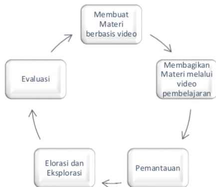
Gambar 1: Strategi Guru dalam Pembelajaran berbasis Flipped Classroom

Berdasarkan gambar 1 dapat dijelaskan sebagai berikut: