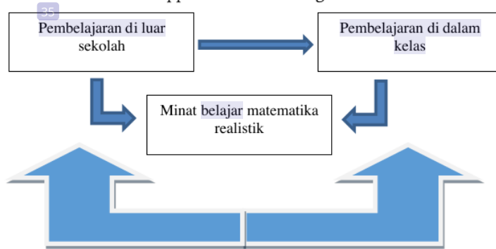
Gambar 3 : Konsep Framework Flipped Classroom

Berdasarkan gambar selanjutnya peneliti merancang framework pembelajaran matematika realistik berbasis flipped classroom sebagai berikut