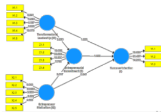
Gambar 2. Model Stuktural (Inner Model)

Hasil uji R-Square menunjukkan bahwa variabel Turnover Intention mempunyai nilai R Square sebesar 0,610 dan nilai R Square Adjusted sebesar 0,519. Untuk variabel Entrepreneurial Commitment mempunyai nilai R Square sebesar 0,668 dan nilai R Square Adjusted sebesar 0,659.