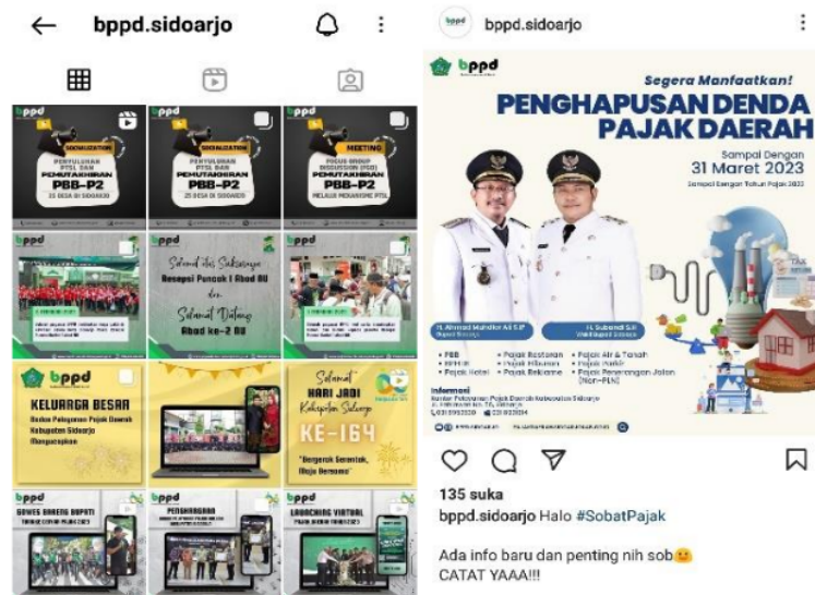
Gambar 1 Sosialisasi melalui akun Instagram resmi milik BPPD Sidoarjo