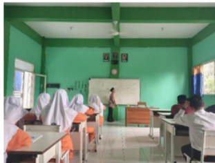
Gambar 3. Proses Pembelajaran Nahwu

Berdasarkan pemaparan di atas terkait metode hal ini sejalan dengan pendapat Kamil Mahmud Addulaimi yang menyebutkan dalam kitabnya, “ Asalib Tadris Qowaid al-Lughah Arabiyyah ” bahwa ada 3 metode pengajaran dalam ilmu nahwu salah satunya metode qiyasyiah, yaitu metode pengajaran bahasa dengan mengajarkan kaidah di awal, kemudian diberikan contohnya, metode ini menuntut murid untuk menghafal kaidah terlebih dahulu kemudian diberikan contoh, pada metode ini pembelajaran dimulai dari yang umum ke khusus artinya jika murid sudah memahami kaidah kebahasaan dilanjutkan dengan memahami contoh [24].