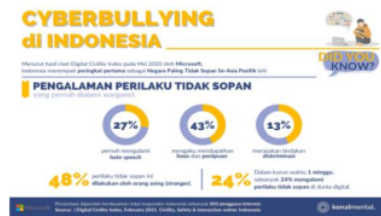
Gambar 2. Cyberbullying di Indonesia

Dengan perkembangan media sosial membuat anak semakin tidak terkontrol dalam penggunaan media sosial sehingga anak akan cenderung fokus pada gadget nya masing-masing sesuai dengan kebutuhan pribadi maupun sekolah. Tanpa disadari kurangnya belajar dan obrolan dengan teman-temannya nah inilah yang terjadi pada anak saat ini, dimana ini terjadi karena ada kebebasan yang berlebihan dalam penggunaan media sosial dan ini yang dapat membahayakan anak dengan itu orang tua harus bisa memberikan perhatian, bimbingan terhadap anak dalam penggunaan media sosial, jika anak sudah bergantung pada internet maka tidak akan memperhatikan nasehat orang tua dan orang-orang yang ada di sekitarnya karena media sosial saat ini dimanfaatkan sebagai tempat untuk menceritakan berbagai macam aktivitas yang dapat memberikan dampak positif dan negatif pada anak.