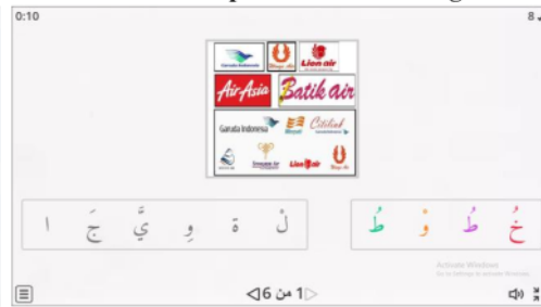
Gambar 4. Tampilan Wordwall Anagram