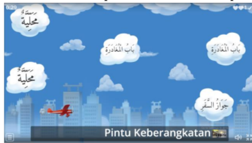
Gambar 3. Tampilan Wordwall Match Up