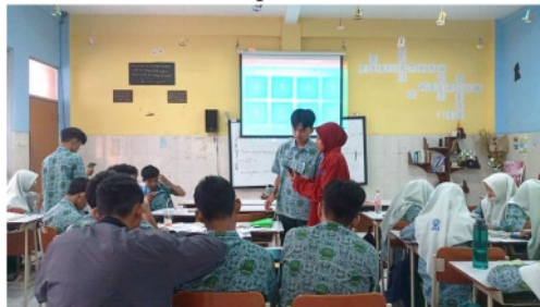
Gambar 5. Penerapan Media Wordwall