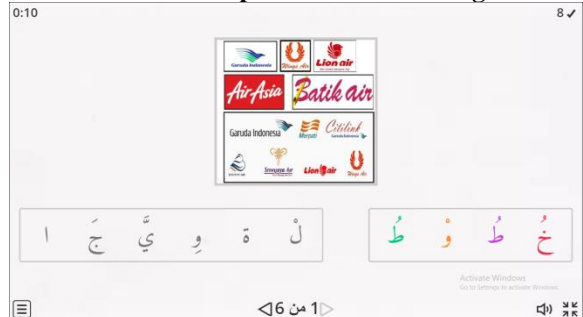
Gambar 4. Tampilan Wordwall Anagram