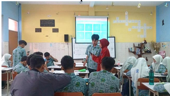
Gambar 5. Penerapan Media Wordwall