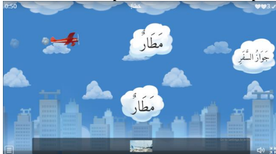
Gambar 3. Tampilan Wordwall Match Up