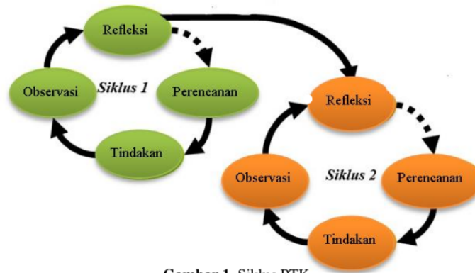
Gambar 1. Siklus PTK

Metode penelitian ini adalah Penelitian Tindakan Kelas (PTK), pola dan struktur penelitiannya memiliki ciri khas, yaitu untuk peningkatan dan perbaikan praktik pendidikan.[22] Penelitian tindakan kelas adalah suatu penelitian yang memiliki sifat reflektif yang dilakukan melalui tindakan yang bertujuan untuk meningkatkan dan memperbaiki kegiatan pembelajaran dengan professional.[23] penelitian tindakan kelas bermanfaat dalam menemukan permasalahan di kelas serta memberi jawaban dari permasalahannya.[24] Penelitian ini menggunakan Model PTK oleh Stephen Kemmis dan Taggart yang dalam satu putaran siklus terbagi jadi empat tahap, meliputi : 1) perencanaan, 2) tindakan, 3) observasi, 4) refleksi.[25]