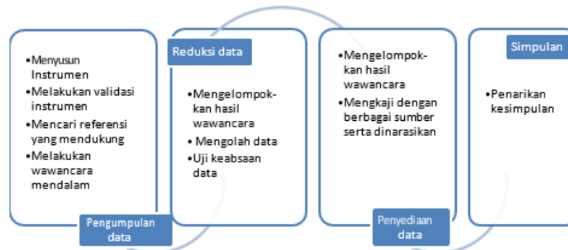
Gambar 1. Teknik Analisis Data Miles dan Huberman

Sumber data pada penelitian ini divalidasi menggunakan teknik triangulasi. Peneliti menggunakan teknik analisis data yang dipopulerkan oleh Miles & Huberman. Pada teknik analisis data tersebut, peneliti memulainya dari proses reduksi data, penyajian data yang diakhiri dengan proses penarikan kesimpulan. Alur analisis data tersebut seluruhnya digunakan untuk melakukan analisis terhadap keseluruhan data yang diperoleh dalam penelitian ini [18].