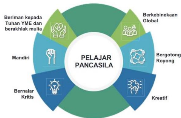
Gambar 2. Profil Pelajar Pancasila

Definisi dari Profil Pelajar Pancasila adalah pelajar yang merupakan pelajar sepanjang hayat yang kompeten, berkarakter, dan berperilaku sesuai nilai-nilai Pancasila. Definisi tersebut memuat tiga kata kunci: pelajar sepanjang hayat, kompeten, dan nilai-nilai Pancasila. Hal ini menunjukkan adanya perpaduan antara penguatan identitas khas Bangsa Indonesia, yaitu Pancasila, sebagai rujukan karakter pelajar Indonesia; dengan kompetensi yang sesuai dengan kebutuhan pengembangan sumber daya manusia Indonesia dalam konteks perkembangan Abad 21 [25]. Jika diejawantahkan lebih mendalam, maka terdapat enam dimensi yang menjadi karakteristik dari Profil Pelajar Pancasila, yaitu: beriman dan bertaqwa kepada Tuhan Yang Maha Esa, berkebhinekaan global, mandiri, bergotong royong, bernalar kritis dan juga kreatif [26]. Penyusunan Proyek Penguatan Profil Pelajar Pancasila pada sebuah satuan pendidikan harus sesuai dengan tema-tema yang sudah ditentukan oleh pemerintah. Tema tersebut adalah kearifan lokal, gaya hidup berkelanjutan, Bhineka Tunggal Ika, bangunlah jiwa dan raganya, suara demokrasi, rekayasa dan teknologi [27].