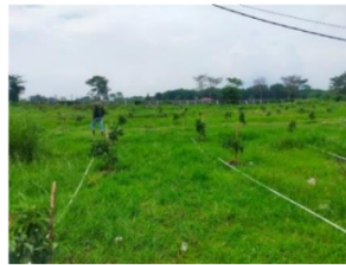
Pengaplikasian Pupuk Cair