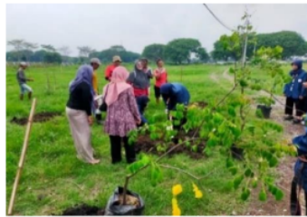
Penanaman Bersama Warga