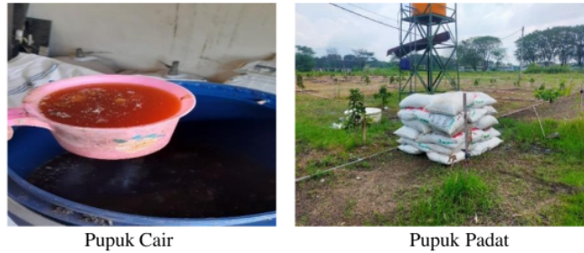
Gambar 2. Hasil Pengelolaan Sampah Organik

4 Berdasarkan gambar 2 tersebut, bahwa pengelolaan sampah bisa dijadikan pupuk cair dan pupuk padat. Penggunaan pupuk cair berbahan limbah organik semakin meningkat sejak berkembangnya tanaman hidroponik karena pupuk cair dapat dengan mudah dicampurkan sesuai dengan kebutuhan tanaman dan mudah diaplikasikan melalui selang. Untuk pengerjaannya menggunakan pupuk cair ini sangat cepat hanya menggunakan selang seperti air mengalir. Pupuk organik padat mengandung banyak unsur hara baik yang besar maupun kecil sehingga bisa memperbaiki struktur kesuburan tanah. Kekurangan penggunaan pupuk padat, akibat pemakaian jangka panjang akan mengakibatkan lahan terparap pupuk padat akan mengeras.