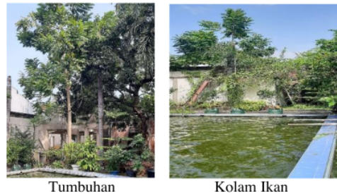
Gambar 3. Pemanfaatan Rumah Kosong

Berdasarkan pada tabel 2 dapat diketahui bahwa jumlah sampah organik yang sudah diolah di Desa Ketapang selama 3 tahun.