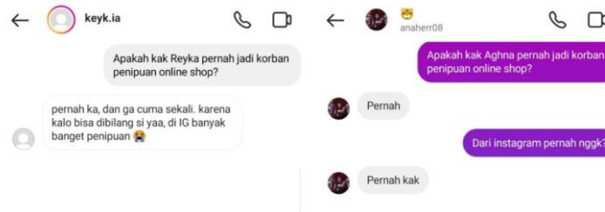
Gambar 3. Direct Message dampak pembelian online

B. Dampak Pembelian Online , dari hasil wawancara melalui direct message penelitian ini hampir ke 5 narasumber mengalami penipuan terhadap online shop, narasumber mengatakan tergiur dengan barang murah, lalu melakukan transaksi pembayaran secara transfer, namun beberapa hari kemudian barang tidak dikirim dan nomor Whatsapp di blokir oleh penjual. Dari berbagai pernyataan tersebut kini dapat dilihat bahwa tidak semua online shop dapat dipercaya.