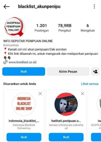
Gambar 1. Beranda Instagram @blacklist_akunpenipu

Berdasarkan data di atas memberi gambaran bahwa masih banyak kasus penipuan online. Masyarakat yang sering berbelanja di sosial media harusnya dapat lebih waspada, dan mencari tahu informasi dalam memilih akun instagram yang terpercaya dan penipu.