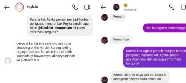
Gambar 4. Direct Message informasi yang di dapat

C. Informasi Yang Di Dapat , dari ke 5 narasumber yang mengikuti akun instagram @blacklist_akunpenipu hampir menyatakan hal yang sama selama mereka mengikuti akun tersebut mereka dapat memperoleh informasi-informasi tentang akun penjualan online shop.