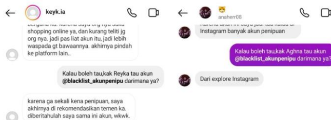
Gambar 5. Direct Message eksistensi akun

D. Eksistensi Akun @Blacklist_akunpenipu , ditunjukkan dengan jumlah followers yang tidak sedikit. Ini berguna agar informasi dapat sampai kepada berbagai kalangan pengguna Instagram. Dengan adanya akun @blacklist_akunpenipu ini narasumber menyatakan bahwa akun tersebut sangat membantu kepada para pengguna instagram dalam menyaring akun-akun penipu. Maka dari itu peran akun instagram @blacklist_akunpenipu sangat berperan penting dalam keputusan pembelian barang secara online di instagram