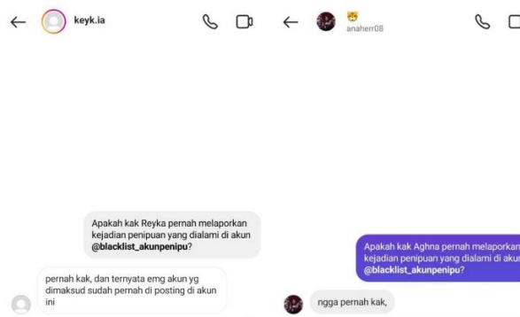
Gambar 6. Direct Message laporan penipuan