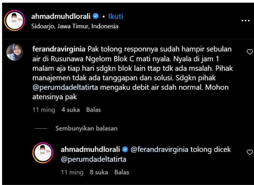
Gambar 4. Aduan masyarakat di kolom komentar Instagram Gus Muhdlor

Dari postingan ini menunjukkan bagaimana Gus Muhdlor menerapkan strategi dari Personal Branding yaitu Position Yourself , beliau sebagai seorang Bupati Sidoarjo dengan cepat merespon sebuah aduan dari masyarakatnya mengenai permasalahan PDAM di wilayahnya, disini beliau sebagai pemimpin tak canggung dan memposisikan dirinya sebagai orang yang setara dengan masyarakatnya, tetapi dia mempunyai sebuah previllage untuk menyelesaikan dan langsung merespon aduan dari masyarakatnya dan menetag akun sosial media Badan Usaha Milik Daerah (BUMD) yang bertugas sebagai penyuplai air bersih, disinilah keunikan dan seorang Gus Muhdlor yang membedakan dirinya dengan kepala daerah yang lain, karena beliau sangat dekat terhadap masyarakatnya. Dalam tulisan Bambang Priyono menyebutkan Personal Branding adalah sumberdaya yang dimiliki seseorang yang dapat dikembangkan, Sumber daya itu sendirilah sebagai faktor utama penentu keberhasilannya [16] Dengan demikian, politisi yang pada awalnya berperan sebagai sumber pesan politik akan berubah menjadi penerima pesan atau informasi, dan publik akan berubah menjadi sumber pesan atau informasi tentang opini publik yang tercipta. Komunikasi yang bersifat timbal balik dan dua arah ini diperankan oleh media massa sebagai alat penyalur.