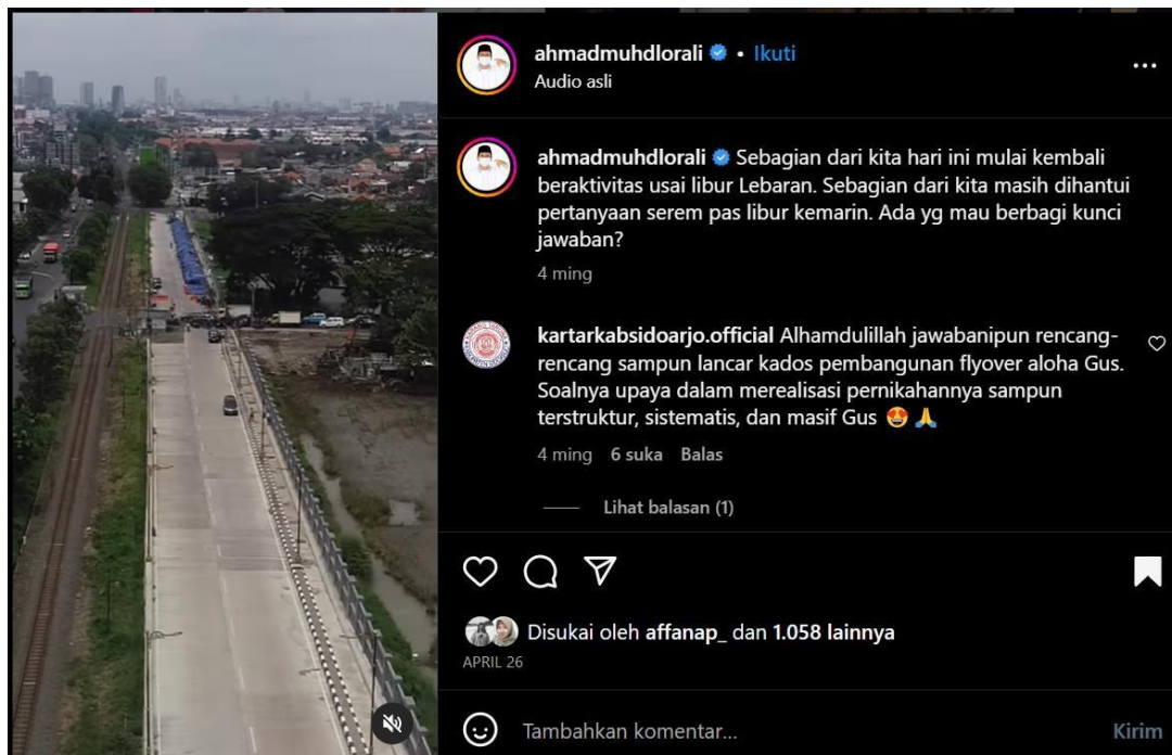
Gambar 2. Bagaimana kalian menjawab pertanyaan “Kapan Nikah?” saat lebaran kemarin?

Dalam postingan ini Gus Muhdlor mengenalkan sebuah pencapaian kerjanya yakni pembangunan Frontage Gedangan, untuk mengurai kemacetan di wilayah tersebut, yang menariknya disini adalah tulisan dari video tersebut “ Bagaimana Kalian Menjawab Pertanyaan “Kapan Nikah?” Saat lebaran Kemarin? disinilah tak hanya mengenalkan sebuah pencapaiannya dalam membangun frontage, Fadhol Tamimy [14] menjelaskan karakter seseorang dapat tergambar pada sosial media yang mereka miliki sehingga seseorang perlu menampilkan hal-hal positif agar mendapat kesan yang positif dari publik. Gus Muhdlor adalah orang yang masih berjiwa muda atau biasa disebut millennial karena pertanyaan kapan nikah, sangat identik dengan millennial sekarang, disinilah pengaplikasian Determine What You Do dan Position Yourself dilakukan, beliau walaupun seorang Bupati memposisikan dirinya sebagai seorang millennial karena umurnya yang masih muda, dan membuat postingan itu nampak menarik dikalangan milenial Sidoarjo. Dalam membangun personal branding melalui media Instagram Gus Muhdlor menggunakan fitur visual yang diunggulkan Instagram dalam menyampaikan pesan personal branding yang dibentuk. Konten-konten yang diunggah ke dalam akun Instagram pun memiliki keselarasan dengan ambisi pribadi yang dimiliki. Menurut [15] pada dasarnya penetapan branding dapat memberikan kelebihan branding suatu produk dan jasa.