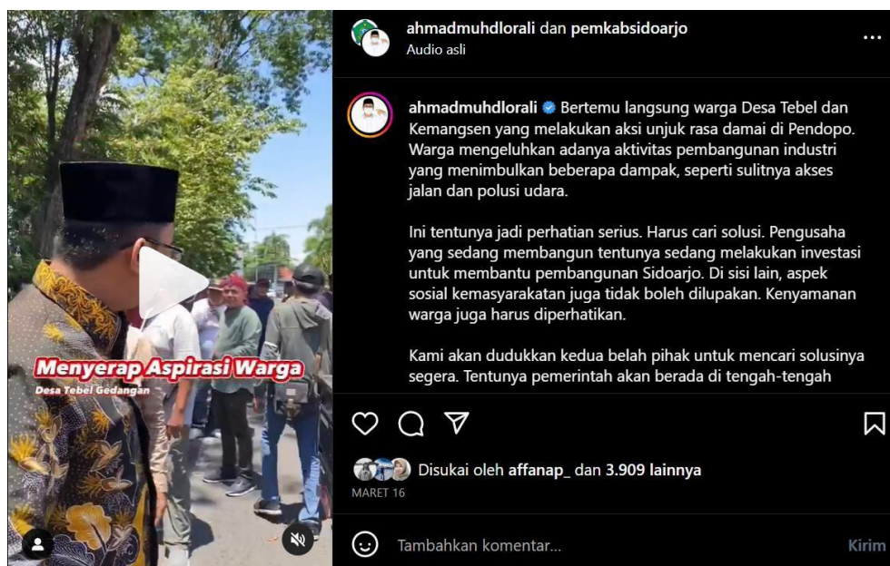
Gambar 1. Menyerap Apirasi Warga

Salah satu postingan di Instagramnya menyebutkan dengan kata “Menyerap Aspirasi Warga” ini adalah sebuah strategi yang dilakukan oleh Gus Muhdlor dalam membentuk sebuah persepsi dari pengikutnya bahwa Gus Muhdlor adalah orang yang peduli terhadap masyarakat, disinilah Personal Branding Gus Muhdlor dibentuk, Determine Who You Are, inilah Gus Muhdlor Bupati Sidoarjo yang peduli dengan masyarakatnya dan menyerap aspirasi dari masyarakatnya.