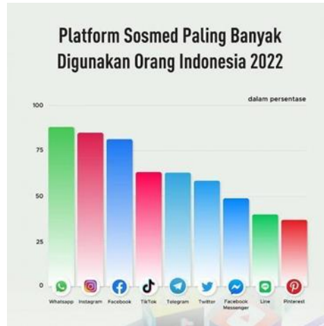
Gambar 1.1 Data Media Sosial Yang Paling Banyak Digunakan

mudah. Saat ini jangkauan media sosial dalam hal penyebaran informasi sangat luas. Informasi dapat menyebar dengan cepat dengan adanya media sosial. Tidak itu saja, isi pesan yang diberikan oleh penulis berhasil dengan cepat mendapatkan kepercayaan dari masyarakat umum (warga) dan berhasil mengatasi penerimaan luas dari media (mainstream) yang selama ini diakui sebagai berita yang terkini dan akurat (Suyono, 2020).