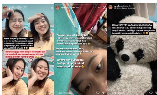
Gambar 1.3 Contoh Unggahan Second Account Inisial AN

Selanjutnya informan ke empat inisial HH (Perempuan), ia menyampaikan saat ini ia mempunyai akun Instagram tiga. informan ke empat ini adalah seorang fangirl/ K-pop. akun pertama digunakan untuk menciptakan kesan publik terhadap dirinya, akun kedua digunakan untuk kegiatan fangirling, ia dapat mengekspresikan kesenangannya ketika mengunggah tentang K-pop di akun kedua ini sehingga informan merasa nyaman dan aman ketika membagikan di akun tersebut, dan ia juga punya akun ketiga untuk bisnis, ia selalu mengunggah foto atau video minuman di akun tersebut.