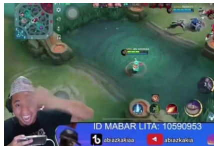
Gambar 5. Gerakan tangan menunjuk

Gerakan tangan juga diberikan oleh Ustadz Abi agar mad'u lebih mudah dalam memahami pesan dakwah yang disampaikan. seperti gambar berikut :