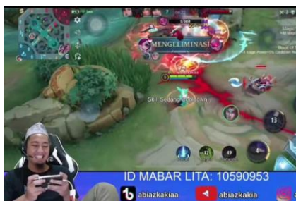
Gambar 2. Sikap santai badan ustadz Abi

Sikap badan saat berdakwah Ustadz Abi memosisikan dengan duduk santai di atas kursi sambil memegang handphone. terkadang juga menggunakan badan yang tegap ketika tema pembahasan itu penting. terkadang juga santai sambil menggerakkan kursi yang dipakainya. Berikut contoh dari sikap badan Ustadz Abi Azkacia dalam live Tiktokya :