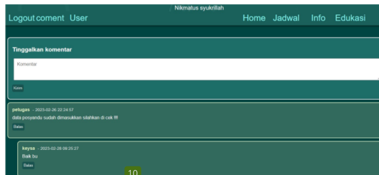
10 Gambar 9. Halaman coment

Gambar 9. Halaman coment merupakan satu halaman yang memungkinkan pengguna membuat komentar/ membalas komentar ke kader posyandu atau sebaliknya