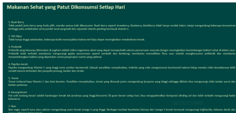
Gambar 10. Halaman edukasi

Gambar 10. Halaman edukasi merupakan satu menu yang memberikan ulasan-ulasan tentang posyandu balita seperti pengertian makanan sehat dll.