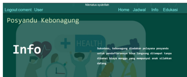
Gambar 5. Halaman home