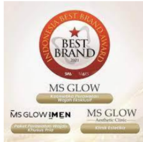
Gambar 1.2 Award Best Brand MS.Glow

Selain itu, Ms Glow merupakan salah satu brand kosmetik Indonesia (lokal) yang meraih penghargaan Dari data yang diambil oleh tim internal Kompas pada 69 ribu produk MS Glow Beauty yang terlisting di Shopee melalui metode online crawling , pada bulan Juli 2021 saja MS Glow berhasil menyelesaikan total kurang lebih 376 ribu transaksi