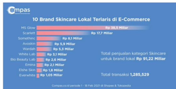
Gambar 1.3 Skincare Terlaris di E-Commerce