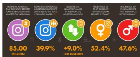
Gambar 1.1 Jumlah Pengguna Instagram

Berdasarkan survei yang dilakukan oleh Global Web Index (2021) yang sudah dirangkum oleh We Are Social dan Hootsuit di tahun 2018 ini menyatakan bahwa sebanyak 86% warganet sudah melakukan belanja online di platform belanja online apapun entah itu di platform belanja online seperti Tokopedia, Shoppe, Lazada, ada pula yang menggunakan media sosial seperti Instagram, Facebook, atau bisa langsung melalui aplikasi chatting seperti whatsapp. Saat ini sudah banyak media periklanan menggunakan media sosial, salah satunya media sosial Instagram.