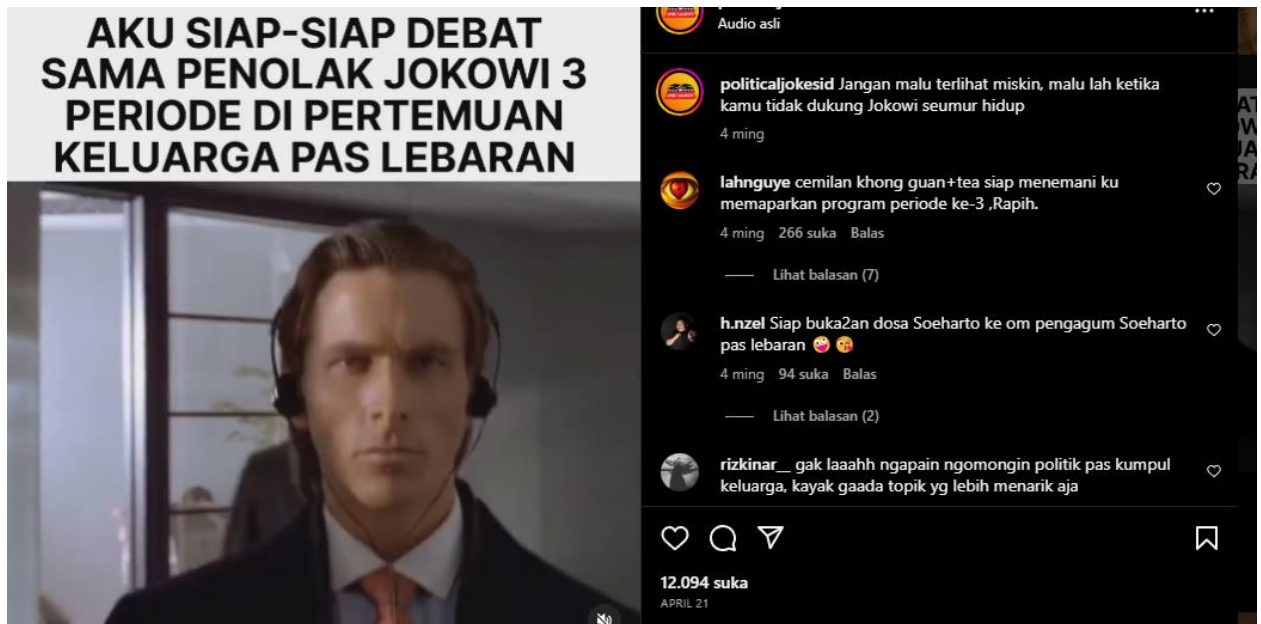
Gambar 3. AKU SIAP-SIAP DEBAT SAMA PENOLAK JOKOWI 3 PERIODE DI PERTEMUAN KELUARGA PAS LEBARAN.