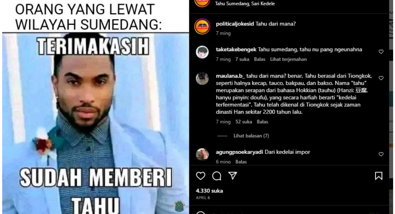
Gambar 5. TERIMA KASIH SUDAH MEMBERI TAHU