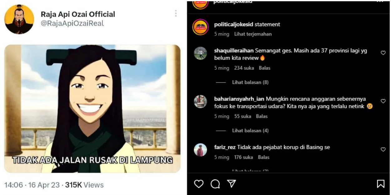
Gambar 7. TIDAK ADA JALANAN RUSAK DI LAMPUNG