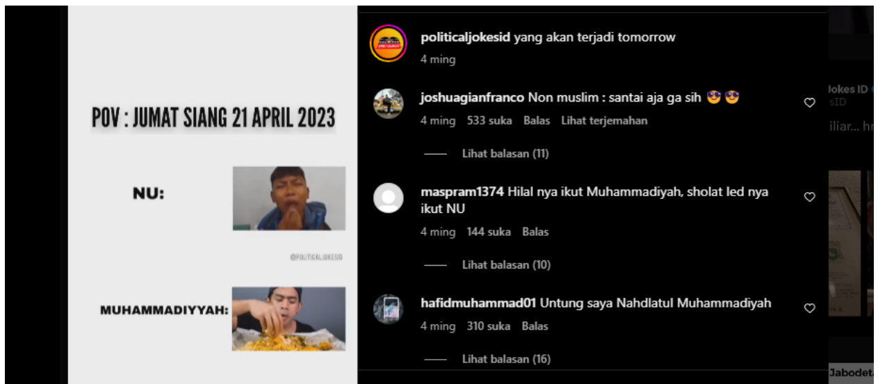
Gambar 6. POV : JUM'AT SIANG 21 APRIL 2023