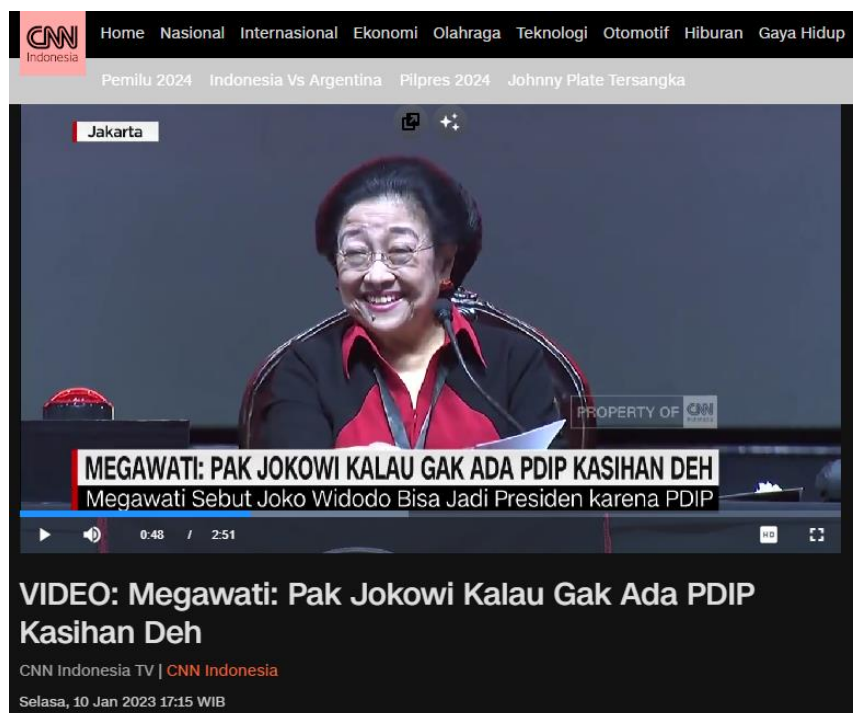
Gambar 1. Tangkapan Layar Dari Akun Bintang Emon (sebelah kiri) cuplikan berita dari CNN Indonesia tentang Megawati : Pak Jookowi kalau gak ada PDIP Kasihan deh (sebelah kanan)