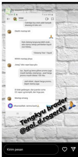
Testimoni dari salah satu konsumen yang sudah berbelanja di cc_vapor dengan promo melalui media sosial instagram.