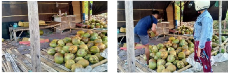
Gambar 3.2 Usaha Sewa Stand Kelapa

Berdasarkan uraian 3 pernyataan informan diatas, maka dapat ditarik kesimpulan bahwa peran BUMDes mampu Memperkokoh perekonomian rakyat sebagai dasar kekuatan dan ketahanan perekonomian nasional dengan BUMDes sebagai pondasinya.