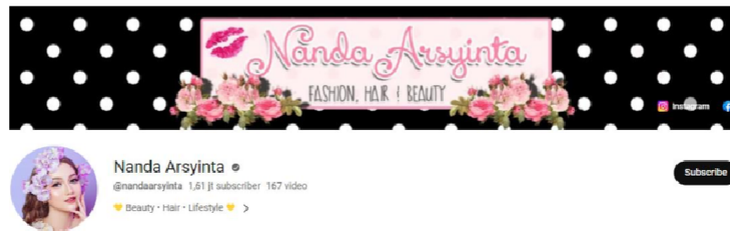
Gambar 1 Channel Youtube Nanda Arsyinta

Nanda Arsyinta menjadi beauty vlogger terkenal, dengan kontennya yang menarik di kalangan penonton wanita tentang kecantikan make up dan skincare. Nanda Arsyinta merupakan Beauty Vlogger yang memiliki 1,61 juta subscribe , channel YouTube Nanda Arsyinta dibuat pada 21 desember 2010. Dalam konten YouTube Nanda Arsyinta ini tidak hanya mengenai kecantikan saja, Nanda juga mengupload video yang bertema challenge dan daily vlog . Nanda Arsyinta memiliki banyak like dan beragam komentar yang positif dari penontonnya. Channel youtube Nanda Arsyinta banyak digemari oleh penonton wanita karena memiliki konten kecantikan yang menarik dan menyenangkan dalam memberikan informasi seputar kecantikan. Video Nanda Arsyinta pun banyak diberi likes dan komentar yang positif. Nanda Arsyinta menjadi Brand Ambassador dan berkolaborasi dengan brand local Azarine pada tahun 2021, Nanda x Azarine mengeluarkan produk series vitamin yang ada 3 produk yaitu, Magic Colour Lip Serum , Let It Go & Made My Day Primer Serum , dan juga Instant Glow Peel Off Nail Polish . Dimana semua persiapan sudah diatur sebaik mungkin dari packaging dan juga komposisi [6].