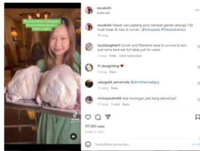
Gambar 3 Masak nasi padang porsi berlipat ganda seharga 13jt buat mbak & mas di rumah