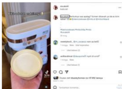
Gambar 7 Berikutnya rasa apalagi? Komen dibawah ya ide es krim kalian!