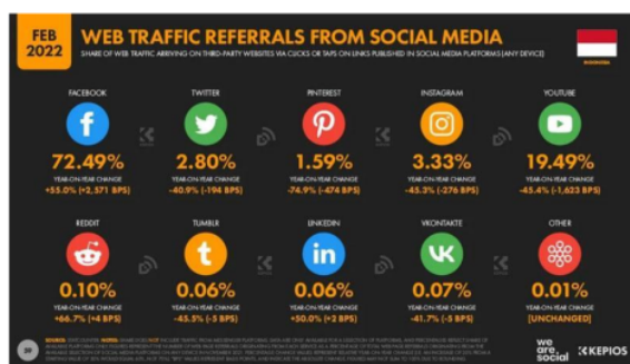
Gambar 1 Pengguna sosial media dan internet di Indonesia 2022

Instagram sebagai media baru untuk berinteraksi dan berkomunikasi saat ini. Selain itu juga digunakan untuk menyalurkan kreatifitas untuk membantu media berbisnis dengan tujuan membentuk brand perusahaan (Sundawa & Trigartanti, 2018) Instagram sudah menjadi kebutuhan semua kalangan masyarakat modern saat ini sebagai kebutuhan informasi (Nofha Rina, 2020). Sebagai media yang digunakan oleh para kaum muda instagram menjadi alat untuk menyampaikan informasi bahkan sebagai media untuk mempersuasi (Gumilar et al., 2018). Semakin berkualitas isi media dalam Instagram maka semakin terpenuhi pula kebutuhan informasi dan edukasi untuk memenuhi kebutuhan penggunaan instagram (Muhamad Fauzi Rohimat Desfiana & Karsa, 2021). Umumnya di kalangan remaja kebutuhan menggunakan instagram ada berbagai macam alasan baik kebutuhan menambah pengetahuan mengenai dunia, sebagai ajang berekspresi, mengetahui identitas diri, media berkomunikasi dan berbagi cerita kebutuhan berkhayal atau hiburan (Prihatiningsih, 2017). Penggunaan instagram di Indonesia sendiri memiliki 99,15 juta pengguna di Indonesia pada awal 2022 dengan 52,3 persen audiens iklan Instagram di Indonesia adalah perempuan, sedangkan 47,7 persen adalah laki-laki (Gaungmedia.com, 2022)