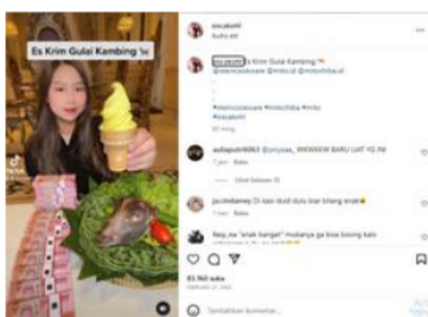
Gambar 8 Es Krim Gulai Kambing

Pada gambar 7 peneliti juga menemukan alat memasak yang digunakan oleh Sisca merupakan alat yang tergolong menengah keatas. Dalam konten Berikutnya rasa apalagi? Komen dibawah ya ide es krim kalian! itu sisca menggunakan mixer MITO yang digunakan untuk mengaduk adonan es krim. Dilihat dalam tokopedia.com mixer MITO merupakan barang dengan harga 2.5 juta.