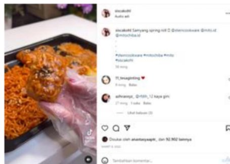
Gambar 5 Samyang spring roll

Sementara seperti yang terlihat pada gambar 4 penggunaan jenis font yang dipakai adalah san serif font dengan tujuan agar pesan yang disampaikan melalui subtitle bisa lebih jelas dan mudah dipahami (Ernawati, 2019). Selain itu masyarakat akan lebih menyukai jika menggunakan font sesuai yang dapat dibaca dan menarik (Utoyo, 2020). Hal yang sama juga terlihat pada vidio yang di unggah Sisca Kohl lainnya seperti vidio Es Krim Tes Kriuk yang di unggah pada 1 februari 2022, Es Krim Gulai Kambing , dan Masak nasi padang porsi berlipat ganda seharga 13jt buat mbak & mas di rumah . Pada gambar 1 dan 2 warna-warna yang digunakan dalam setiap subtitle nya adalah warna netral, soft pastel yang dominan warna putih, hitam, coklat. Penggunaan warna netral dan soft pastel agar pengukutnya lebih nyaman saat mengunjungi halaman instagram @siscakohl dan terkesan cute, ceria, kalem (Aldina Ramadhanti dkk, 2022). Pada gambar 4 sisca juga menambahkan emoticon pada akhir subtitle yang sisca tampilkan hal ini juga terlihat pada unggahan sisca yang berjudul Es Krim Tes Kriuk , Es Krim Gulai Kambing , dan vidio lainnya. Emoticon digunakan sebagai media pembantu dalam komunikasi non verbal yakni pengganti ekspresi, mewakili maksud dari sebuah teks, dan mewakili emosi (Rodiyatun Nahwiyyah, 2020). Penggunaan emoticon dalam percakapan melalui media sosial bisa menghindari kesalahpahaman yang terjadi ketika para penulis pesan hanya mengungkapkan emosinya melalui tuturan (Sari, 2016).