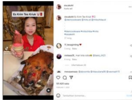
Gambar 4 Es Krim Tes Kriuk