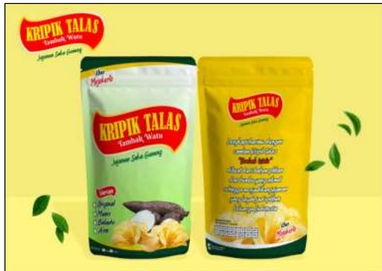
Gambar 2 Desain Kemasan Kripik Talas hasil Kansei

Berdasarkan pengolahan data yang telah dilakukan diperoleh perancangan kemasan untuk kemasan kripik di IKM Kripik Talas. Desain kemasan telah memenuhi keinginan dari persepsi konsumen yang diperoleh dari pengolahan data terhadap kuesioner tingkat kepentingan, sebagai berikut[26] :