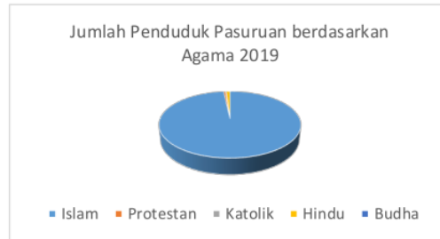
Grafik 1. Jumlah Umat Islam di Pasuruan 2019

Pesatnya perkembangan ekonomi Indonesia dipengaruhi oleh munculnya Lembaga Keuangan Syariah. Pada Lembaga Keuangan Syariah, nasabah berkeinginan agar seluruh penerimaan yang diperoleh dari Lembaga Keuangan Syariah tersebut halal dan toyyibah. Adapun beberapa macam Lembaga Keuangan Syariah yaitu BMT, Koperasi Syariah, BPRS dan Bank Syariah. Sebagai negara dengan penduduk beragama Islam terbesar di dunia, tentunya merupakan salah satu potensi yang memudahkan bagaimana sosialisasi penerapan Lembaga Keuangan Syariah di Indonesia, khususnya di Pasuruan. Namun hingga saat ini, sosialisasi pada Lembaga Keuangan Syariah masih belum efektif dan efisien yang mengakibatkan jumlah nasabah Lembaga Keuangan Syariah masih tergolong sedikit dikarenakan kurangnya upaya mensosialisasikan agar diterima secara luas dan rasional oleh masyarakat membuat Lembaga Keuangan Syariah tidak hanya dipercaya keunggulannya di kalangan fanatik syariah, tetapi juga lebih mudah diakses oleh semua kalangan.