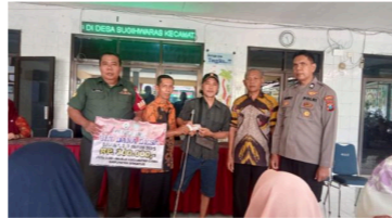
Gambar 5. Pendampingan Oleh Perangkat Desa, BPD, Babinsa, dan Bhabinkamtibmas

Dalam konteks disposisi Desa Sugihwaras, Nur Amiril, S.AP menyatakan sebagai berikut, yaitu: "Disposisi didahului oleh pemerintah pusat untuk memberikan kode pencairan dana BLT-DD yang dibagi menjadi suku-suku satu kali, setelah itu pelaksana kegiatan meminta bendahara desa untuk melakukan proses pencairan dengan persetujuan kepala desa dan sekretaris desa setelah tahap itu selesai baru kemudian bank dapat memberikan dana BLT DD kepada KPM"