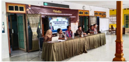
Gambar 2. Sosialisasi Penyaluran BLT-DD

Komunikasi merupakan elemen penting dalam keberhasilan implementasi kebijakan. Kesuksesan dapat dicapai jika pengambil keputusan memahami melalui komunikasi yang lancar, tepat, akurat, dan konsisten. Komunikasi yang efektif memungkinkan kebijakan disebarluaskan dengan baik, serta mencegah distorsi atau penolakan. Ada tiga komponen penting untuk komunikasi kebijakan: transmisi, di mana pesan harus disampaikan tanpa distorsi; kejelasan, sehingga pesan tidak menimbulkan kebingungan; dan konsistensi, untuk menghindari kebingungan di lapangan [11].