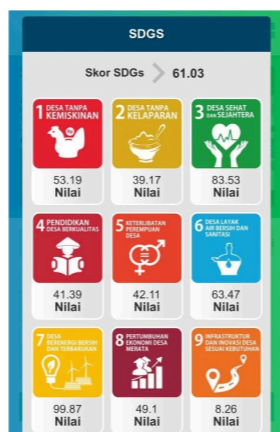
Gambar 1. SDGs Desa Sugihwaras Kecamatan Candi Kabupaten Sidoarjo

SDGs merupakan suatu program dunia jangka panjang untuk mengoptimalkan semua potensi dan sumber daya yang dimiliki oleh tiap negara. Meskipun data BPS mencatat penurunan angka kemiskinan dalam beberapa tahun terakhir, jutaan orang masih hidup di bawah garis kemiskinan [3]. Dampaknya tidak hanya menyentuh aspek ekonomi, tetapi juga bidang pendidikan, kesehatan, dan kualitas hidup pada umumnya. Menghadapi kondisi tersebut, pada September 2015, 189 negara berkumpul di Perserikatan Bangsa-Bangsa dan meratifikasi deklarasi Tujuan Pembangunan Milenium (MDGs) [4]. Salah satu tujuan deklarasi ini adalah untuk mengurangi jumlah orang yang hidup dalam kemiskinan sebesar 50% pada tahun 2015. Deklarasi ini menunjukkan bahwa kemiskinan masih menjadi masalah besar yang perlu ditangani secara kolektif. Dengan selesainya MDGs yang berhasil mengurangi jumlah penduduk miskin di dunia hampir Setelah MDGs berhasil menurunkan angka kemiskinan hampir setengahnya, muncul Sustainable Development Goals (SDGs) yang secara resmi diluncurkan pada Majelis Umum PBB di New York, 25-27 September 2015. Pertemuan tersebut menegaskan dokumen SDGs yang disepakati oleh 193 negara anggota PBB, melanjutkan proses ratifikasi awal pada 2 Agustus 2015. Dokumen "Transforming Our World: The 2030 Agenda for Sustainable Development" dirancang untuk memperkuat dan membawa pencapaian MDGs ke fase berikutnya [5].