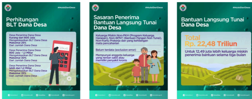
Gambar 3. Infografis BLT-DD