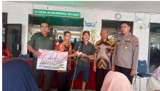
Gambar 5. Pendampingan Oleh Perangkat Desa, BPD, Babinsa, dan Bhabinkamtibmas

"Disposisi didahului oleh pemerintah pusat untuk memberikan kode pencairan dana BLT-DD yang dibagi menjadi suku-suku satu kali, setelah itu pelaksana kegiatan meminta bendahara desa untuk melakukan proses pencairan dengan persetujuan kepala desa dan sekretaris desa setelah tahap itu selesai baru kemudian bank dapat memberikan dana BLT DD kepada KPM"