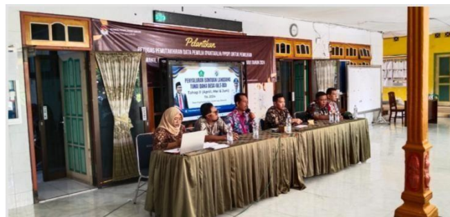
Gambar 2. Sosialisasi Penyaluran BLT-DD

Komunikasi merupakan elemen penting dalam keberhasilan implementasi kebijakan. Kesuksesan dapat dicapai jika pengambil keputusan memahami melalui komunikasi yang lancar, tepat, akurat, dan konsisten. Komunikasi yang efektif memungkinkan kebijakan disebarluaskan dengan baik, serta mencegah distorsi atau penolakan. Ada tiga komponen penting untuk komunikasi kebijakan: transmisi, di mana pesan harus disampaikan tanpa distorsi; kejelasan, sehingga pesan tidak menimbulkan kebingungan; dan konsistensi, untuk menghindari kebingungan di lapangan [11].