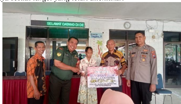
Gambar 4. Penyaluran BLT Tahap 1 Tahun 2025

"Alhamdulillah untuk menjalankan program ini tim solid dan tidak terlalu keberatan, meskipun ada kendala di awal, namun kita bisa menyelesaikannya sesuai target yang telah ditentukan"