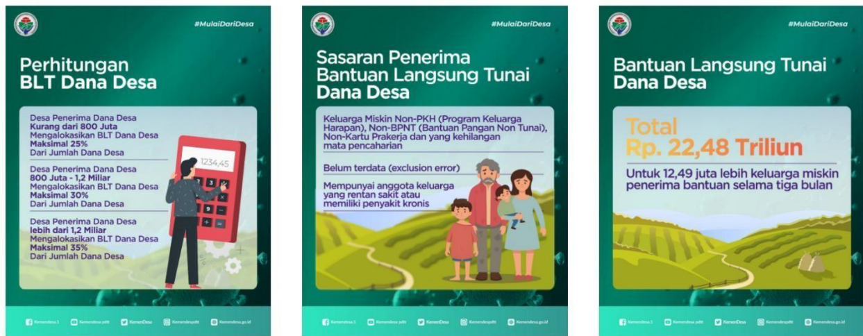
Gambar 3. Infografis BLT-DD

"Ya Bu, sebelum kita ingin melaksanakan program prioritas penggunaan dana desa, kita sudah berkomunikasi dengan kepala RT dan RW serta stakeholder terkait"