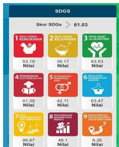
Gambar 1. SDGs Desa Sugihwaras Kecamatan Candi Kabupaten Sidoarjo