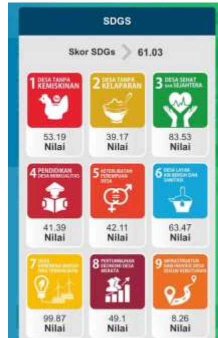
Gambar 1. SDGs Desa Sugihwaras Kecamatan Candi Kabupaten Sidoarjo

Berdasarkan data SDGs Desa Sugihwaras Kecamatan Candi Kabupaten Sidoarjo, pada tujuan “Desa Tanpa Kemiskinan” diperoleh skor sebesar 53,19. Nilai tersebut menunjukkan bahwa upaya pengurangan kemiskinan di Desa Sugihwaras berada pada kategori sedang dan masih memerlukan peningkatan dalam beberapa aspek kesejahteraan masyarakat.