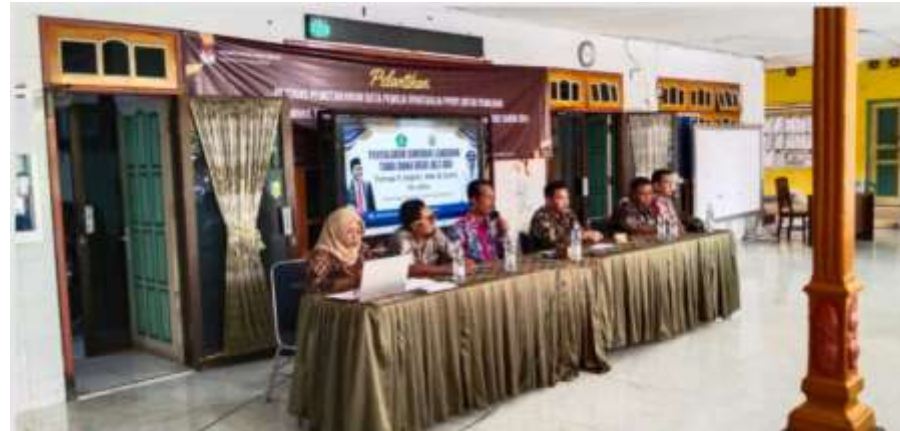
Gambar 2. Sosialisasi Penyaluran BLT-DD

Komunikasi dalam pelaksanaan program BLT-DD di Desa Sugihwaras dilakukan melalui musyawarah dan koordinasi antara pemerintah desa, BPD, RT/RW, dan masyarakat. Hal ini bertujuan agar informasi mengenai program dapat dipahami dengan jelas oleh masyarakat sehingga pelaksanaan bantuan berjalan lebih tepat sasaran.