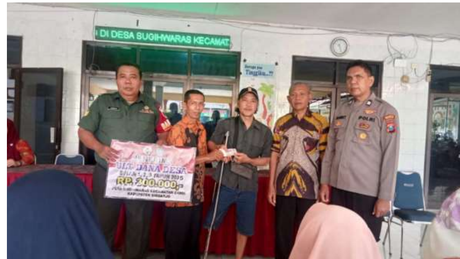
Gambar 5. Pendampingan Oleh Perangkat Desa, BPD, Babinsa, dan Bhabinkamtibmas

"Disposisi didahului oleh pemerintah pusat untuk memberikan kode pencairan dana BLT-DD yang dibagi menjadi suku-suku satu kali, setelah itu pelaksana kegiatan meminta bendahara desa untuk melakukan proses pencairan dengan persetujuan kepala desa dan sekretaris desa setelah tahap itu selesai baru kemudian bank dapat memberikan dana BLT DD kepada KPM"