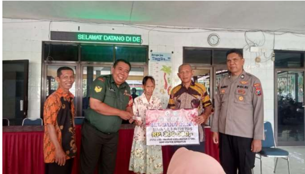
Gambar 4. Penyaluran BLT Tahap 1 Tahun 2025

"Alhamdulillah untuk menjalankan program ini tim solid dan tidak terlalu keberatan, meskipun ada kendala di awal, namun kita bisa menyelesaikannya sesuai target yang telah ditentukan"