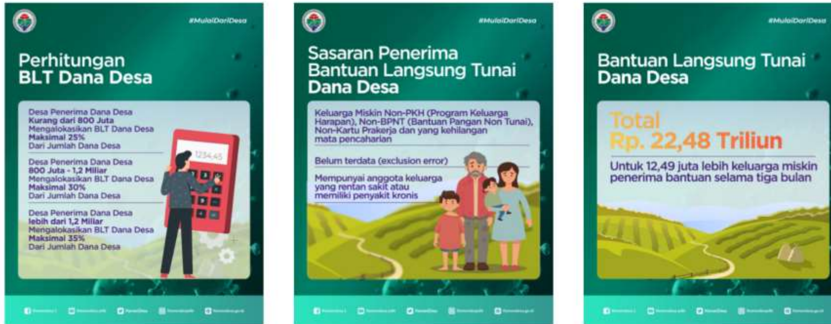
Gambar 2. Infografis BLT-DD