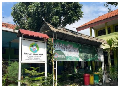
Gambar 2.1 Dokumentasi SDN Kedungturi

Selama pelaksanaan penelitian, pembelajaran IPA pada materi ekosistem dilaksanakan dengan memanfaatkan lingkungan sekitar sekolah sebagai sumber belajar. Siswa diajak secara langsung ke taman sekolah untuk melakukan pengamatan terhadap komponen biotik dan abiotik yang ada di lingkungan tersebut. Kegiatan ini dilakukan pada dua kali pertemuan dengan fokus pada identifikasi dan hubungan antar komponen ekosistem. Setelah kegiatan observasi dilakukan, siswa mendiskusikan hasil pengamatan dan menyampaikan temuan mereka secara lisan.