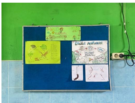
Gambar 5.1 Hasil kerja siswa membuat poster Ekosistem

Berdasarkan kegiatan tersebut, terlihat bahwa siswa mulai mampu menyebutkan dan mengelompokkan komponen ekosistem sesuai dengan hasil pengamatan langsung. Berdasarkan hasil observasi yang dilakukan selama proses pembelajaran, guru menerapkan pembelajaran IPA berbasis lingkungan dengan mengajak siswa keluar kelas untuk mengamati lingkungan sekolah. Siswa diminta mengidentifikasi komponen biotik dan abiotik yang mereka temukan di sekitar taman dan halaman sekolah. Selama kegiatan berlangsung, siswa terlihat aktif berdiskusi dan mencatat hasil pengamatan. Beberapa siswa mampu menyebutkan contoh makhluk hidup seperti tumbuhan dan serangga, serta benda tak hidup seperti tanah, air, dan cahaya matahari. Hasil wawancara dengan guru menunjukkan bahwa pembelajaran yang melibatkan lingkungan sekitar membantu siswa memahami konsep ekosistem dengan lebih mudah karena siswa melihat secara langsung objek yang dipelajari. Guru menyampaikan bahwa siswa lebih cepat memahami materi ketika pembelajaran dilakukan secara kontekstual dibandingkan hanya melalui penjelasan di dalam kelas. Selain itu, berdasarkan hasil wawancara dengan beberapa siswa, mereka menyatakan lebih senang belajar di luar kelas karena dapat melihat contoh nyata dari materi yang dipelajari. Hal ini menunjukkan adanya peningkatan pemahaman materi biotik dan abiotik melalui pembelajaran berbasis lingkungan.