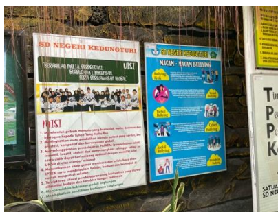
Gambar 1.1 Dokumentasi Sekolah Berbasis Lingkungan Sekitar