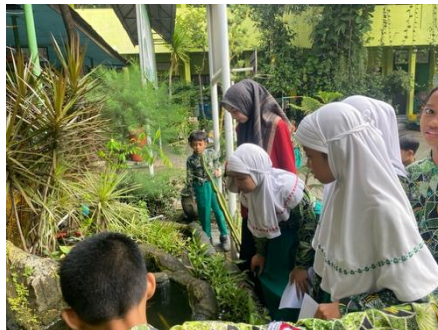
Gambar 3.1 Dokumentasi Pembelajaran di Lingkungan Sekolah

Selama pelaksanaan penelitian, pembelajaran IPA pada materi ekosistem dilaksanakan dengan memanfaatkan lingkungan sekitar sekolah sebagai sumber belajar. Siswa diajak secara langsung ke taman sekolah untuk melakukan pengamatan terhadap komponen biotik dan abiotik yang ada di lingkungan tersebut. Kegiatan ini dilakukan pada dua kali pertemuan dengan fokus pada identifikasi dan hubungan antar komponen ekosistem. Setelah kegiatan observasi dilakukan, siswa mendiskusikan hasil pengamatan dan menyampaikan temuan mereka secara lisan.