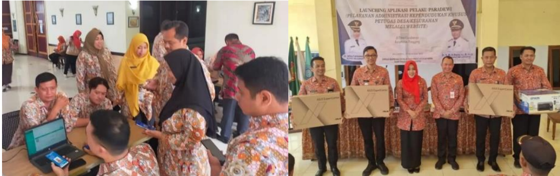
Gambar 2. Sosialisasi Peresmian Aplikasi Pelaku Paradewi oleh Disdukcapil Kabupaten Mojokerto Sumber. Diolah dari Pemerintah Desa Bleberan (2025)

Namun, kegiatan sosialisasi terkait penggunaan aplikasi tersebut baru dilaksanakan satu kali, yaitu pada saat peresmian aplikasi oleh Disdukcapil Kabupaten Mojokerto. Setelah kegiatan tersebut, belum terdapat sosialisasi lanjutan maupun pendampingan teknis secara berkala kepada perangkat desa sebagai operator aplikasi. Kondisi tersebut menyebabkan operator desa lebih banyak mempelajari penggunaan aplikasi secara mandiri selama proses pelayanan berlangsung.