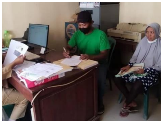
Gambar 4. Pengurusan Akta Kematian Melalui Aplikasi Pelaku Paradewi

Hal tersebut menunjukkan adanya kemampuan adaptasi dalam penerapan E-Government di tingkat desa. Penggunaan aplikasi Pelaku Paradewi yang didukung dengan media komunikasi yang sudah familiar bagi masyarakat, seperti WhatsApp dan email , menjadi faktor penting dalam meningkatkan efektivitas pelayanan administrasi kependudukan. Selain mempermudah proses pelayanan, penggunaan media digital tersebut juga membuat interaksi antara pemerintah desa dan masyarakat menjadi semakin adaptif dan responsif.