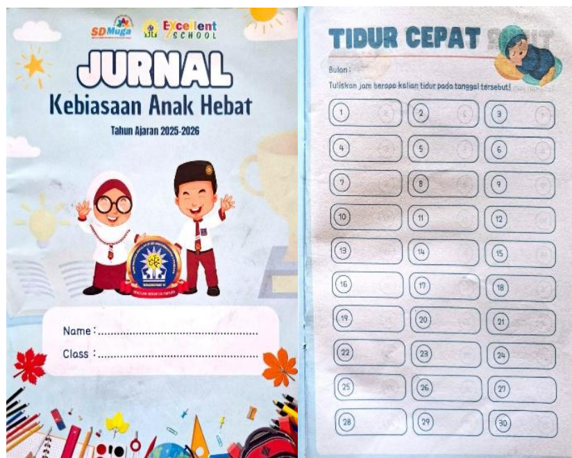
Gambar 2. Buku Jurnal 7 KAIH [4]

Pola hidup sehat siswa diarahkan pada pengelolaan waktu istirahat yang optimal. Dalam penerapannya, indikator tidur cepat diinternalisasi melalui pendekatan edukatif yang terintegrasi antara pembinaan kesehatan dan penguatan nilai keislaman. Guru memberikan pemahaman mengenai pentingnya tidur cukup bagi kesehatan tubuh, kesiapan belajar dan keseimbangan aktivitas siswa sehari-hari, yang diperkuat dengan penjelasan adab tidur dalam Islam sesuai anjuran nabi Rasulullah SAW seperti beristirahat setelah melaksanakan salat Isya, menjaga kesucian diri dengan berwudhu, dan membaca doa sebelum tidur, serta menjelaskan dampak negatif dari kebiasaan tidur terlalu larut, diantaranya berkurangnya semangat belajar, menurunnya konsentrasi, hingga gangguan kesehatan. Siswa dibimbing untuk mengelola waktu belajar di malam hari agar dapat tidur lebih awal dan bangun dalam kondisi segar untuk melaksanakan salat subuh. Kebiasaan tidur lebih awal selaras dengan ajaran tentang pentingnya menjaga keseimbangan antara aktivitas dan istirahat sebagai bentuk tanggung jawab terhadap diri sendiri. Pemantauan kebiasaan tidur dilakukan melalui Buku Jurnal 7 Kebiasaan Anak Indonesia Hebat, siswa mencatat jam tidur setiap malam. Sekolah memiliki buku jurnal sebagai sarana pemantauan dan pengendalian kebiasaan siswa, Adapun tampilan sampul jurnal yang digunakan di SD Muhammadiyah 3 Pandaan disajikan sebagai berikut: