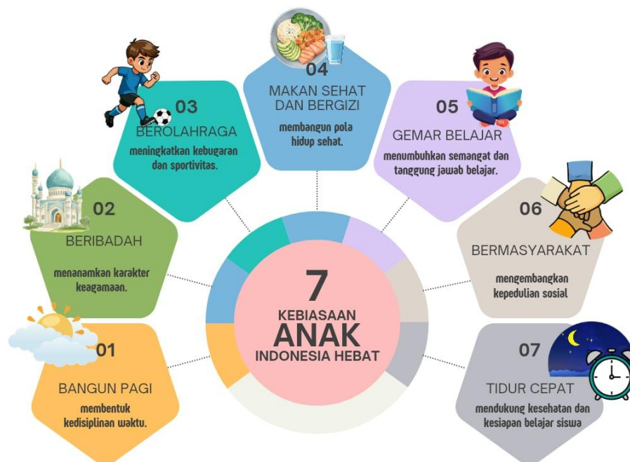
Gambar 3. Diagram 7 KAIH [5]

Hasil penelitian program 7 Kebiasaan Anak Indonesia Hebat tidak diposisikan sebagai kegiatan tambahan, melainkan menjadi bagian dari budaya sekolah yang menyatu dengan pembelajaran intrakurikuler, kokurikuler, dan ekstrakurikuler. Temuan observasi memperlihatkan bahwa siswa telah terbiasa menjalankan 7 kebiasaan dalam rutinitas harian di sekolah. Dokumentasi sekolah seperti jurnal siswa, jadwal kegiatan, dan poster kebiasaan memperkuat temuan tersebut. Integrasi nilai-nilai keislaman menjadi ciri utama dalam pelaksanaan kebiasaan ini. Hal tersebut menunjukkan bahwa implementasi kebiasaan tidak hanya berorientasi pada pembentukan perilaku, tetapi juga pada penguatan nilai religius. Sekolah berperan aktif sebagai lingkungan utama internalisasi karakter siswa [29].