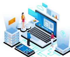
Gambar 1. Tampilan Aplikasi Sistem Pengelolaan Aset Desa (SIPADES)

SIPADES 3.0 Sistem Pengelolaan Aset Desa