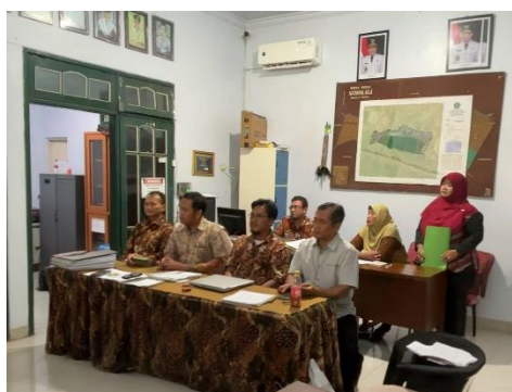
Gambar 3. Sosialisasi Sistem Pengelolaan Aset Desa (SIPADES)

Melalui sosialisasi tersebut, diharapkan operator Desa Sumokali dapat memahami prosedur penggunaan aplikasi SIPADES secara tepat sehingga proses administrasi aset desa dapat berjalan lebih tertib, akurat, dan seragam sesuai standar yang ditetapkan. Adapun dokumentasi kegiatan sosialisasi tersebut dapat dilihat pada gambar berikut yang menunjukkan pelaksanaan sosialisasi kepada operator Desa Sumokali.