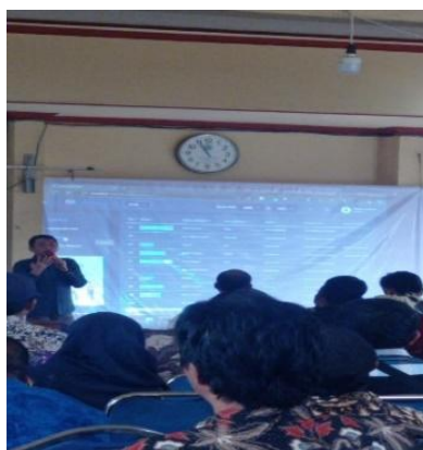
Gambar 1. Sosialisasi Aplikasi SIKS-NG

Untuk memperkuat hasil temuan terkait pelaksanaan sosialisasi, berikut disajikan dokumentasi kegiatan sosialisasi yang dilakukan oleh pemerintah Desa Simoangin-angin melalui forum musyawarah desa :