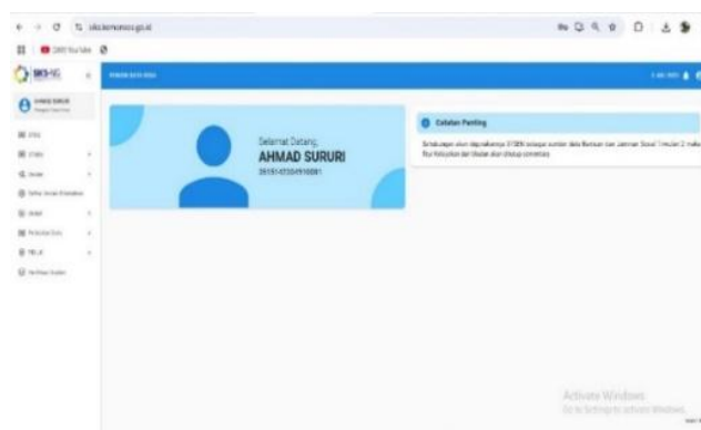
Gambar 1. Tampilan Dashboard Aplikasi SIKS-NG

Penerapan aplikasi Sistem Informasi Kesejahteraan Sosial Next-Generation (SIKS-NG) merupakan salah satu bentuk implementasi e-Government dalam bidang kesejahteraan di Indonesia. Aplikasi ini dimanfaatkan oleh pemerintah desa untuk mengelola data kemiskinan, melakukan pemutakhiran data serta mengusulkan calon penerima bantuan sosial berdasarkan Data Terpadu Kesejahteraan Sosial (DTKS) yang sekarang berganti nama menjadi Data Tunggal Sosial dan Ekonomi Nasional (DTKSEN) sebagai upaya dalam meningkatkan kesejahteraan masyarakat. Pemerintah Desa Simoangin-Angin telah memanfaatkan aplikasi Sistem Informasi Kesejahteraan Sosial-Next Generation (SIKS-NG) sebagai sarana pendukung dalam meningkatkan efektivitas dan efisiensi pengelolaan data kemiskinan di tingkat desa. keberadaan aplikasi ini memberikan kemudahan bagi pemerintah desa, terutama dalam hal penginputan dan pembaruan data sosial yang dilakukan oleh Kasi Kesejahteraan selaku operator aplikasi