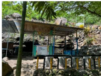
Gambar 2. Letak Warung Area Coban Binangun

Selain promosi, pengelola juga memiliki rencana pengembangan fasilitas wisata, seperti pembangunan area outbound, meskipun rencana tersebut belum dituangkan dalam dokumen perencanaan resmi. Upaya pengembangan ini menunjukkan adanya orientasi jangka menengah dalam memperluas jenis aktivitas wisata yang ditawarkan kepada pengunjung, walaupun implementasinya masih bertahap dan menyesuaikan dengan kemampuan sumber daya yang tersedia. Strategi program lainnya diwujudkan melalui penyediaan warung-warung kecil disekitar area wisata sebagai bagian untuk memenuhi kebutuhan pengunjung. Tetapi juga menjadi sarana pendukung bagi warga yang terlibat dalam kegiatan kerja bakti dan penjagaan lokasi wisata.