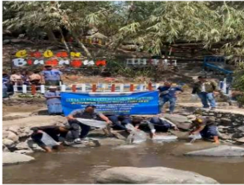
Gambar 4. Pelaksanaan Tabur Benih Ikan Bersama Dinas Perikanan

Temuan tersebut diperkuat dengan dokumentasi kegiatan tabur benih ikan yang dilaksanakan bersama Dinas Perikanan sebagai salah satu bentuk kerja sama eksternal yang pernah dilakukan. Kegiatan ini menunjukkan adanya inisiatif kolaboratif antara pengelola wisata dengan instansi pemerintah, meskipun masih bersifat insidental dan belum menjadi bagian dari program kelembagaan yang berkelanjutan.