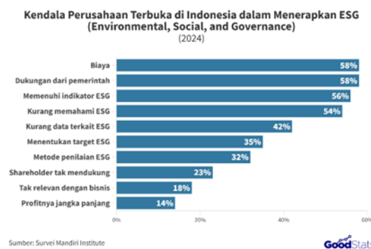
Gambar 1. Kendala Perusahaan Terbuka di Indonesia dalam Menerapkan ESG (2024)

Hubungan antara inovasi hijau dan kinerja perusahaan sering dipengaruhi oleh kondisi keuangan yang dimiliki perusahaan. Penerapan inovasi hijau umumnya membutuhkan biaya besar untuk kegiatan penelitian, pengembangan, dan investasi teknologi, sehingga dapat menimbulkan tekanan biaya pada jangka pendek. Mandiri Institute (2024) juga mencatat bahwa tingginya biaya menjadi salah satu hambatan utama dalam penerapan aspek ESG yang ditunjang oleh inovasi, sebagaimana diakui oleh 58% perusahaan yang disurvei [26]. Keberhasilan inovasi hijau dalam meningkatkan kinerja ESG dan kinerja perusahaan sangat bergantung pada kondisi internal perusahaan, terutama ketersediaan pendanaan.