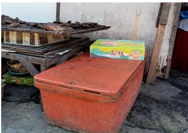
Gambar 2. Alat Coolbox Sarana Bantuan dari Pertamina Program CSR

Berdasarkan pernyataan tersebut dapat diketahui bahwa bantuan permodalan yang berasal dari instansi pemerintah di luar desa, seperti Dinas Koperasi dan CSR, memiliki pengaruh positif terhadap perkembangan usaha ikan asap. Hal ini menunjukkan bahwa tambahan modal yang diterima mampu membantu pelaku usaha dalam meningkatkan kapasitas produksi, memperbaiki kualitas pengelolaan usaha, serta mendorong peningkatan pendapatan.