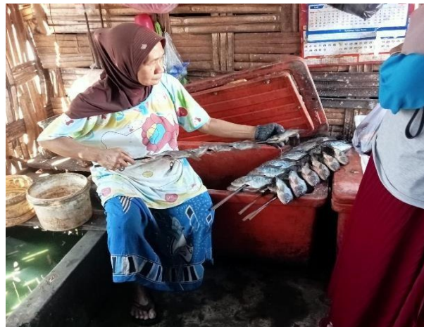
Gambar 1. Produksi Ikan Asap Desa Penatarsewu

Berdasarkan pernyataan tersebut hal ini menunjukkan bahwa pengelolaan usaha ikan asap di Desa Penatarsewu masih didominasi oleh metode tradisional, baik dari sisi produksi maupun pemasaran. Kondisi ini mengindikasikan bahwa transformasi menuju pemanfaatan teknologi digital dalam pengembangan usaha masih terbatas, sehingga diperlukan upaya peningkatan literasi digital dan pendampingan agar usaha dapat berkembang lebih optimal dan mampu bersaing di pasar yang lebih luas. Berikut adalah dokumentasi produksi ikan asap: