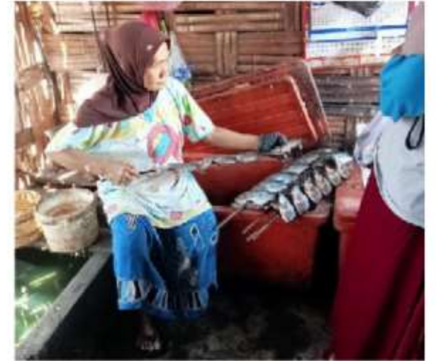
Gambar 1. Proses Penusukan Ikan dengan bambu / bilah kayu.

Berdasarkan data Pemerintah Desa Penatarsewu Tahun 2025, terdapat sekitar 30 pelaku usaha ikan asap dan 4 supplier yang terlibat dalam kegiatan produksi maupun distribusi. Produk ikan asap dipasarkan ke beberapa wilayah seperti Tanggulangin, Porong, dan Sidoarjo. Permintaan pasar tergolong stabil, namun sebagian besar pelaku usaha masih menggunakan alat produksi sederhana, pengemasan tradisional, dan belum memiliki legalitas usaha maupun sertifikasi halal.