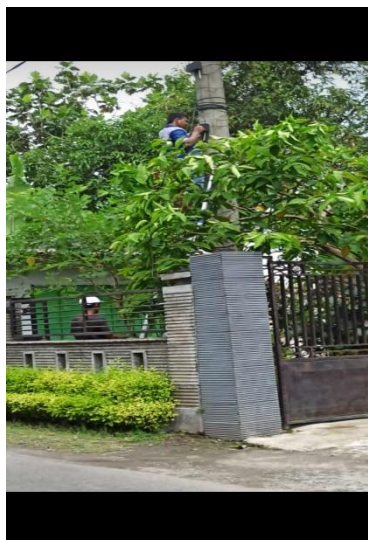
pasangan WIFI ID