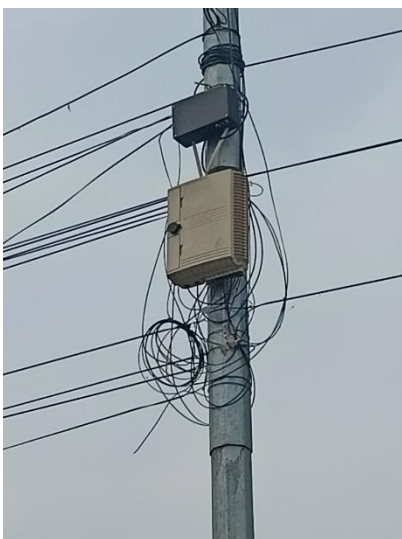
Router box wifi