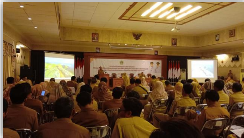
Gambar 1. Sosialisasi Aplikasi POEDAK

“Terkait dukungan pemerintah desa untuk POEDAK, Aplikasi apapun yang diturunkan pemerintah ya kita dukung 100%, karena itu untuk kepentingan desa juga, kalau tidak didukung nanti ketinggalan. Kalau misal aplikasinya udah lama ada, tapi semisal baru kayak koperasi merah putih itu tidak langsung ada anggaran, harus melakukan pengajuan dulu, anggaran biaya tidak langsung muncul, ada biayanya tahun depan, kalau pun terpaksa harus merubah anggaran, harus direncanakan 1 tahun sebelumnya. Koperasi merah putih itu juga tidak ada anggarannya tapi pemerintah memaksa harus ada anggarannya, jadi ya terpaksa kita harus mencoret-coret dan itupun harus dilakukan musyawarah desa. Sosialisasi setiap program mudah karena ada rapat rutin ditiap tanggal 1, lewat rt, kalau ibu-ibu bisa lewat kader atau pkk, kadang juga kita bisa share lewat group whatsapp. Pelatihan dan sosialisasi dilakukan dua kali dalam setahun. Kegiatan ini bertujuan agar perangkat desa dan masyarakat lebih memahami tata cara penggunaan aplikasi POEDAK. Melalui pelatihan tersebut, operator desa menjadi lebih terampil dalam mengoperasikan sistem dan memberikan bimbingan kepada masyarakat yang mengalami kesulitan.”