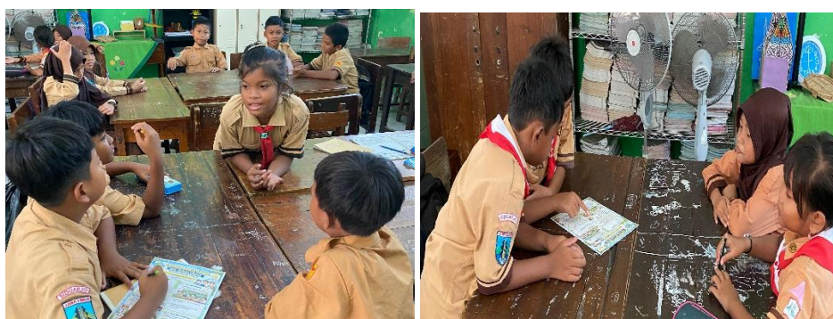
Gambar 3. Diskusi Kerjasama dalam Berkelompok

sarana efektif dalam menanamkan nilai toleransi melalui pengalaman langsung[28]. Para siswa yang sudah terbiasa dengan adanya keberagaman melalui pembelajaran dan interaksi yang tidak ada diskriminasi membuat mereka dapat membagi peran ketika bekerja sama dalam kelompok[29]. Kemudian berkembang pada rasa empati para siswa ketika mereka dapat menunjukkan kepeduliannya dengan cara membantu dan mendukung temannya yang mengalami kesulitan ketika belajar bersama, tentunya ke anak yang berkebutuhan khusus [30]. Interaksi yang berlangsung ketika pembelajaran dan keseluruhan proses didukung melalui implementasi nilai kearifan local seperti bergotong royong, kegiatan seni dan proyek P5 menanam tumbuhan bersama. Kegiatan-kegiatan tersebut selain memperkuat Kerjasama, tetapi juga menjadi sarana mengembangkan sikap toleransi siswa melalui pengalaman langsung. Melalui keaktifan siswa dalam kegiatan budaya yang nyata tersebut, siswa belajar untuk saling menghargai perbedaan teman, membangun rasa empati, dan mengembangkan sikap siswa inklusif, ini sesuai seperti pemikiran Ki Hajar Dewantara bahwa Pendidikan wajib berakar pada budaya, sehingga proses pembelajaran ini menjadi lebih bermakna dan kontekstual bagi kehidupan siswa[31].