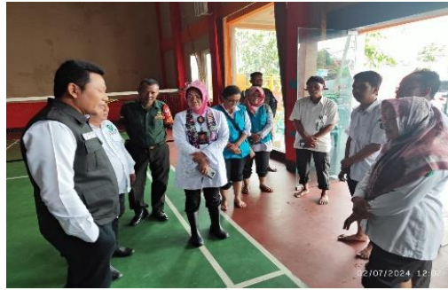
Gambar 2. Peninjauan Langsung Oleh Bupati Sidoarjo, Bapak H. Subandi, S.H., M.Kn., Sumber: Dokumentasi Staf Desa Bungurasih

Berdasarkan indikator struktur birokrasi dalam model Edward III, bahwa Desa Bungurasih telah memiliki alur koordinasi penanggulangan bencana yang sistematis dan formal. Jalur pelaporan dari warga ke RT/RW, dilanjutkan ke perangkat desa, kecamatan, hingga BPBD Kabupaten Sidoarjo berjalan selaras dengan standar operasional prosedur (SOP) yang berlaku. Struktur ini tercermin dalam pembagian tugas yang jelas antar pemangku kepentingan desa, serta adanya kesadaran kelembagaan untuk bertindak sesuai peran masing-masing ketika bencana terjadi. Hal ini menandakan bahwasanya struktur dasar birokrasi di tingkat desa sudah tersedia dan dapat diaktifkan ketika terjadi bencana.