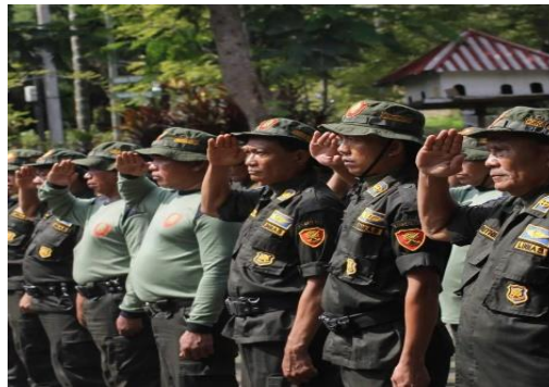
Gambar 1. Peningkatan Kapasitas LINMAS Untuk Bimtek dan pelatihan Mitigasi bencana