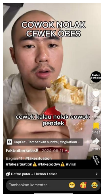
Gambar 10: Konten akun TikTok @fakboiberkelas8