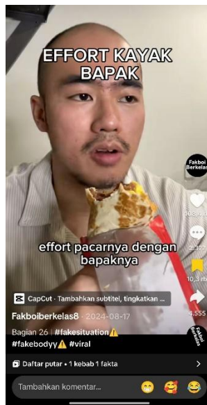
Gambar 11: Konten akun TikTok @fakboiberkelas8