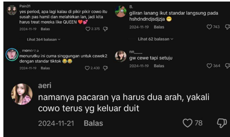
Gambar 4: Komentar dari audiens pada konten @fakboiberkelas8

Beberapa komentar dari para netizen pun bervariasi, ada yang kurang terima dengan konten tersebut, namun juga ada yang sependapat.