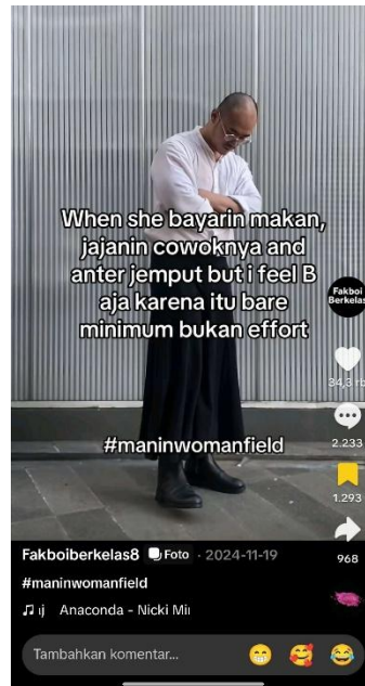
Gambar 3: Konten dari akun TikTok @fakboiberkelas8

Tren #maninwomanfields di TikTok bukan hanya sekadar hiburan atau parodi, tren ini juga mencerminkan bentuk kritik sosial terhadap stereotip gender dan perilaku tidak sehat dalam hubungan. Konten yang dibuat biasanya menampilkan laki