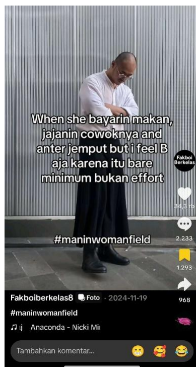
Gambar 2: Contoh konten akun TikTok @fakboiberkelas8

Berikut merupakan salah satu contoh konten dari akun TikTok @fakboiberkelas. Dalam konten tersebut, menampilkan teks dengan latar belakang berupa foto dari pemilik akun. Teks yang tertulis berupa teks yang bersifat satir dan menyindir kaum perempuan yang memiliki stereotip gender seperti yang ia tuliskan. Melalui konten dengan tema satiris seperti ini, akun TikTok @fakboiberkelas8 berusaha untuk mendekonstruksi stereotip gender yang ada di TikTok. Dengan gaya konten menyindir secara halus dan disertai parodi, banyak yang merasa relate atau berkaitan dengan dirinya, sehingga banyak juga yang mendukung, namun juga ada yang tidak terima dan tetap berpegang teguh pada stereotip yang mereka yakini.