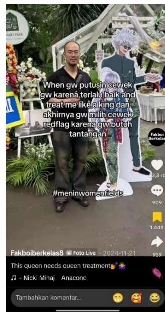
Gambar 6: Konten akun TikTok @fakboiberkelas8