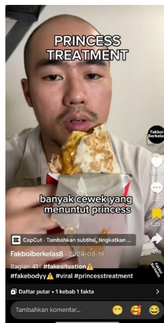
Gambar 12: Konten akun TikTok @fakboiberkelas8