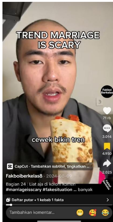
Gambar 13: Konten akun TikTok @fakboiberkelas8

Konten terakhir juga bertemakan satu kebab satu fakta, memperoleh 885 ribu jumlah tayangan, 71 ribu jumlah suka, dan 3000 komentar. Pemilik akun TikTok @fakboiberkelas8 mengutarakan "cewe bikin tren marriage is scary langsung pada merasa yang paling tersakiti, tapi ketika cowo bikin tren tersebut, cewe cewe ga terima dan malah pada adu nasib" kemudian mengatakan "oke". Setelah mengucapkan "oke", pria tersebut memakan kebab sebagai gestur ikoniknya untuk menyampaikan satire secara visual tanpa konfrontatif.