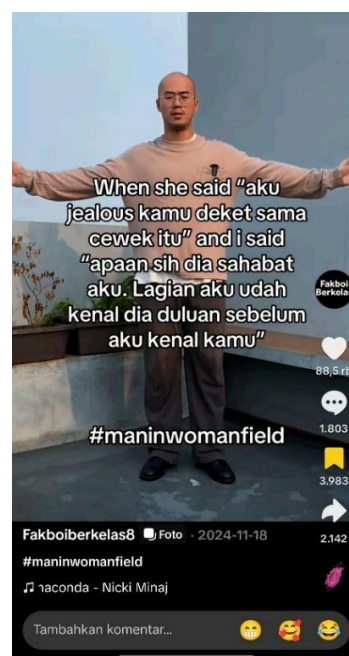
Gambar 5: Konten akun TikTok @fakboiberkelas8