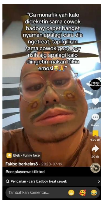
Gambar 7: Konten akun TikTok @fakboiberkelas8