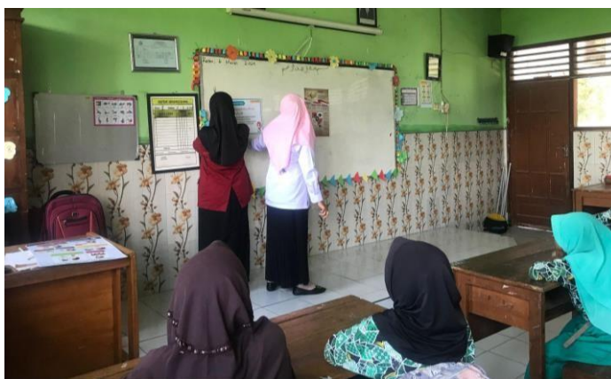
Gambar 3.2 menganalisis pendidikan karakter

Sekolah memainkan peran penting dalam membantu peserta didik membentuk karakter religius, dan guru memegang tanggung jawab besar dalam menciptakan lingkungan yang mendukung hal tersebut. Untuk memperkuat pendidikan karakter religius di SDN Trompoasri 2, tersedia pelajaran agama yang efektif. Hal ini tercermin dalam upaya guru agama yang memberikan arahan tertib dalam membaca doa dan memberikan bimbingan yang konsisten. Selain itu, guru agama menunjukkan kepedulian dengan terus memantau kegiatan ibadah peserta didik di rumah. Apabila ada peserta didik yang mengganggu teman saat beribadah atau enggan beribadah, mereka diberikan sanksi berupa membaca surat-surat pendek untuk memberikan kesadaran dan memperbaiki perilaku. Penguatan pendidikan karakter religius ini berhubungan erat dengan moralitas, etika, dan perilaku baik, yang pada akhirnya menghasilkan budi pekerti yang luhur, serta menunjukkan bahwa karakter individu dapat menjadi faktor pembeda di antara orang lain.