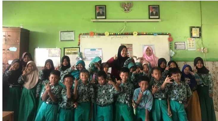
Gambar 3.3 Proses foto bersama dengan guru dan siswa