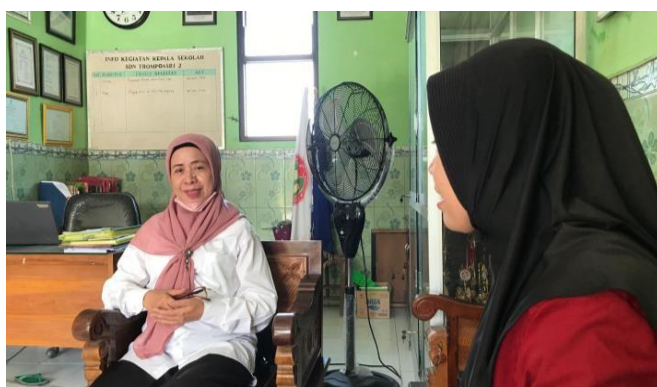
Gambar 3.1 dokumentasi bersama kepala sekolah

Sekolah Dasar Negeri Trompoasri 2 penguatan pendidikan karakter religius menjadi fokus yang telah direncanakan. Untuk mencapai tujuan dengan hasil yang sempurna, program tersebut memerlukan perencanaan yang maksimal. Diperlukan kerjasama dan tanggung jawab beberapa orang dengan keterampilan, pengalaman dan berbakat di bidang terkait untuk berhasil melaksanakan rencana program. Seperti guru, tidak hanya menjadi pengajar tetapi juga menjadi contoh teladan yang menginspirasi para siswa dalam menjalani kehidupan berdasarkan prinsip-prinsip keagamaan di kelas. karena tanpa hal tersebut, kemajuan program dapat terhambat dalam mencapai tujuan yang ditetapkan. Peran-peran seperti pengaturan program, pelaksanaan kegiatan, serta visi dan misi sekolah memiliki peranan penting dalam memperkuat aspek religius dalam program pendidikan karakter. Dengan Penguatan karakter religius ini, SD Negeri 2 Trompoasri berupaya mendidik generasi yang tidak hanya berkemampuan akademik tinggi, namun juga memiliki karakter keagamaan yang kuat