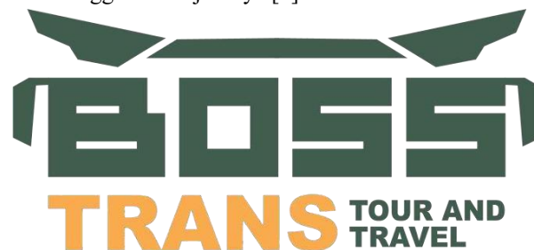
Gambar 1 Logo Boss Trans Tour and Travel

Para jasa travel harus mempunyai pilihan cara yang dapat membuat promosi lebih menarik para konsumen serta dapat memberikan inovasi ke konsumen, sehingga jasa travel diberikan pemahaman perihal perilaku konsumen di kondisi pasar yang dituju dengan melakukan cara penawaran yang menyediakan layanan berkualitas tinggi kepada pelanggan; semua agen perjalanan menggunakan strategi ini untuk tetap kompetitif dengan agen perjalanan lainnya. Hal tersebut juga menjadi sebuah faktor penting yang harus diperhatikan bagi jasa travel Boss Trans Tour and Travel untuk selalu memantau pada kualitas pelayanan yang menjadi acuan dalam menggerakkan jasanya.[7]