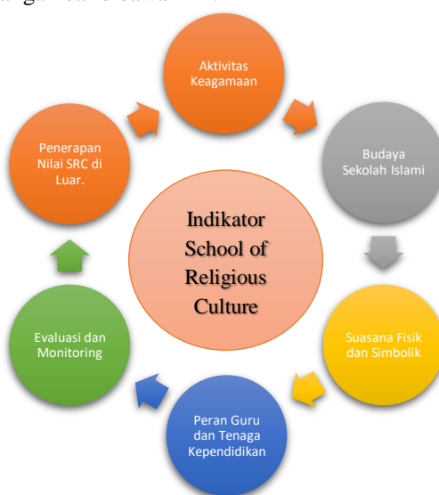
Gambar 1.1 Indikator School Of Religious Culture Sumber:[12]–[21]

Dalam rangka mewujudkan budaya sekolah yang menanamkan nilai-nilai keagamaan secara terencana dan berkelanjutan maka Indikator dalam penelitian ini meliputi: : Aktivitas Keagamaan, Budaya Sekolah Islami, Suasana Fisik dan Simbolik, Peran Guru dan Tenaga Kependidikan, Evaluasi dan Monitoring, Penerapan Nilai SRC di Luar. Adapun bagan pemetaannya sebagai gambar dibawah ini: