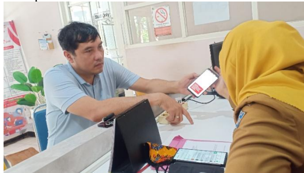
Gambar 2. Pelayanan Konsultasi Klampid New Generation (KNG) di Kelurahan Wonorejo

Kelurahan Wonorejo merupakan salah satu kelurahan yang berada di Kecamatan Rungkut, Kota Surabaya. Dengan luas wilayah \pm 650 ha, kelurahan ini merupakan kelurahan terluas kedua di Kecamatan Rungkut. Kelurahan Wonorejo merupakan salah satu daerah penyangga pusat kota Surabaya. Sebagai salah satu daerah penyangga, keberadaan Kelurahan Wonorejo menjadi semakin penting dari waktu ke waktu. Tidak dapat dipungkiri bahwa semakin berkembang dan majunya suatu wilayah, maka semakin banyak pula penduduk yang menempati wilayah tersebut. Pertambahan penduduk terjadi karena beberapa faktor, antara lain kelahiran dan migrasi. Hal ini secara langsung mempengaruhi kepadatan penduduk.