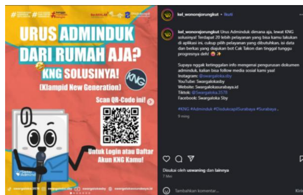
Gambar 4. Poster informasi pengurusan layanan Klampid New Generation (KNG)