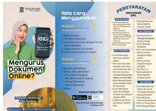
Gambar 5. Brosur Klampid New Generation (KNG)