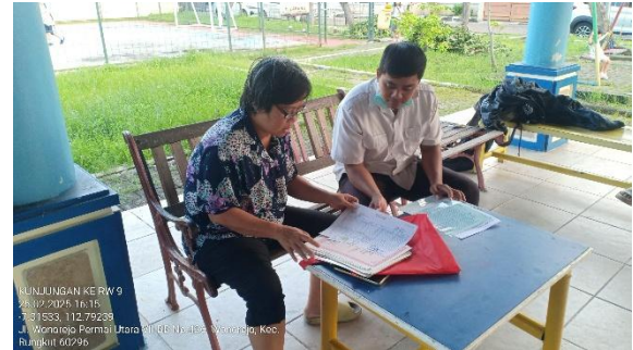
Gambar 8. Jemput Bola Administrasi Kependudukan di RW 09 Kelurahan Wonorejo