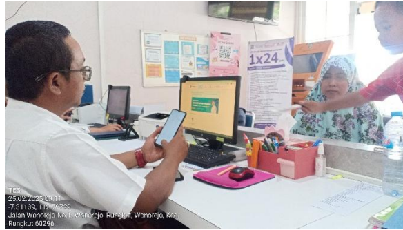
Gambar 7. Petugas membantu warga menggunakan aplikasi Klampid New Generation (KNG)

lebih jelas, dan tidak membingungkan, bahkan bagi masyarakat yang belum terbiasa menggunakan layanan berbasis digital.[17].