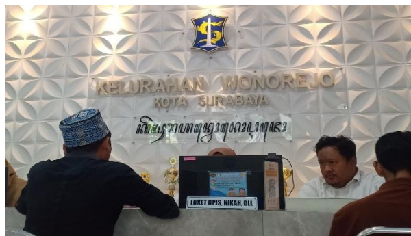
Gambar 3. Pelayanan Dokumen Adminduk di Kelurahan Wonorejo

Kantor Kelurahan Wonorejo, yang berlokasi di Jalan Raya Wonorejo No. 1, Surabaya, Jawa Timur, melayani masyarakat Senin hingga Kamis pukul 08.00 hingga 16.00, Jumat pukul 08.00 hingga 15.00, dan Sabtu pukul 09.00 hingga 12.00. Selain pelayanan langsung, warga yang ingin mengurus dokumen administrasi kependudukan secara daring juga dapat menggunakan situs web atau aplikasi Klampid New Generation (KNG)[12]. Untuk mengakses layanan ini, pemohon harus memiliki akun yang didaftarkan dengan menggunakan Nomor Induk Kependudukan (NIK), dan hanya dapat dilakukan oleh penduduk yang memiliki Kartu Keluarga (KK) Surabaya. Setelah akun terverifikasi, pemohon dapat mengajukan permohonan sesuai dengan jenis layanan yang tersedia pada website atau aplikasi Klampid New Generation (KNG). Selain layanan di kantor, Kelurahan Wonorejo juga menyediakan layanan jemput bola yang dilakukan setiap hari Selasa pukul 16.00-18.00 di balai RW secara bergilir. Meskipun kualitas pelayanannya setara dengan pelayanan di kantor, namun fasilitas di balai RW masih terbatas karena belum tersedianya perangkat seperti komputer dan printer, sehingga pencetakan dokumen tidak dapat dilakukan di lokasi tersebut [13].