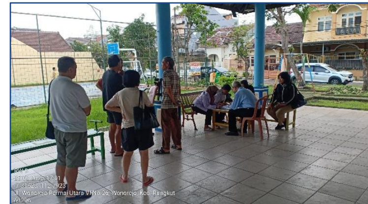
Jemput Bola ADMINDUK di RW 09 Kelurahan Wonorejo