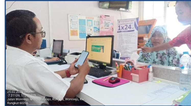
Petugas membantu warga menggunakan aplikasi KNG

Berdasarkan indikator ketepatan sasaran menurut Sutrisno, implementasi Klampid New Generation belum efektif. Meskipun program telah sesuai dengan kebutuhan masyarakat dalam memberikan kemudahan dan efisiensi layanan, pemanfaatannya belum merata dan belum sepenuhnya digunakan secara mandiri. Sebagian masyarakat masih lebih memilih layanan langsung serta bergantung pada bantuan petugas.