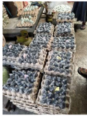
Gambar 1. 3 Produk jual telur asin Sumber: Hasil observasi lapangan

dan ditutup sementara karena banyaknya peminat dari luar Jawa Timur Dukungan dari keluarga, terutama generasi muda, menjadi faktor pendorong dalam proses adopsi teknologi. Diungkapkan oleh pemilik usaha juga bahwa awal sangat tidak mudah untuk membangun usaha ini karena masih memiliki pekerjaan tetap yang tidak bisa ditinggal.