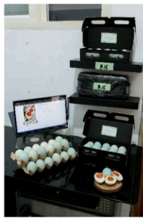
Gambar 1. 4 Foto produk digital marketing

Teori Edward III menjelaskan mengenai struktur birokrasi, meskipun informal, dapat memengaruhi kecepatan dan efektivitas pelaksanaan kebijakan dari hasil analisis observasi dengan pemilik usaha menyebutkan “ beliau pernah mengikuti pemeran dari pemerintah sidoarjo melalui kecamatan buduran dan diberikan bantuan secara finansial sebanyak dua kali dari pemerintah namun selanjutnya pemerintah masih belum ada program lebih lanjut ” oleh karena itu Struktur birokrasi di tingkat daerah dinilai masih bersifat formalistik. Pemilik UMKM menyebutkan bahwa untuk mendapatkan dukungan program lanjutan, mereka harus melalui prosedur administratif yang cukup panjang. Kurangnya koordinasi antar lembaga, seperti antara Dinas Koperasi, Dinas Perdagangan, dan LPK, juga membuat proses digitalisasi berjalan lambat dan tidak terintegrasi. struktur kerja yang sebelumnya cair berubah menjadi lebih terorganisasi. Tugas harian mulai dibagi secara sistematis untuk merespon tuntutan digitalisasi. Temuan ini diperkuat oleh studi Ardiansyah et al., 2022 [23], yang menunjukkan bahwa pembagian tugas berbasis digital mampu meningkatkan efisiensi waktu hingga 25%. Birokrasi pemerintah dalam mendukung digitalisasi UMKM masih memiliki kekurangan dalam koordinasi dan keberlanjutan program. Program pelatihan seringkali berdiri sendiri tanpa tindak lanjut atau sistem mentoring. Selain itu, tidak ada pemetaan UMKM yang siap digital secara real-time di level kecamatan.