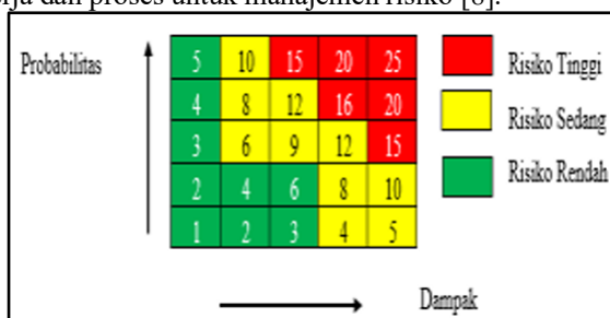
Gambar 2. Tabel Matrix PIM

Sebagai standar internasional, ISO 31000 menyediakan arsitektur manajemen risiko yang mencakup prinsip, kerangka kerja, dan proses. Sinergi dari ketiga elemen ini menjadi kunci utama bagi organisasi dalam memastikan setiap risiko dikelola dengan efektif dan efisien [7]. Secara khusus ISO 31000 telah mendefinisikan kerangka kerja dan proses untuk manajemen risiko [8].